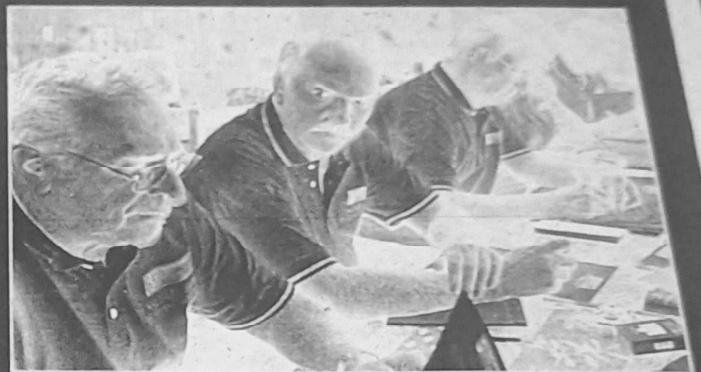
Le comité au travail

Dimanche, dans la matinée, 8 e et quarts de finale, casse-croûte ardéchois. A 14 h 30, demi-finale et enfin à 16 h 30, la grande finale pour