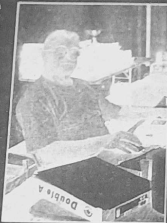
Le comité au travail.

Il est évident qu'en cas de beau temps, les trois journées devraient connaître le succès. Question animations, à ajouter au programme le jour de l'ouverture, ce vendredi au moment où seront rassemblés les compétiteurs, chaque équipe lâchera dans le ciel un ballon tricolore, avec une étiquette à renvoyer du lieu de chute pour gagner un lot. Enfin, dimanche avant le concert de l'Harmonie Aubenas-Vals, un grand spectacle équestre avec "Crinière et Burle". Vals va vivre quelques moments forts qui marqueront cette 8 e édition du championnat de France.