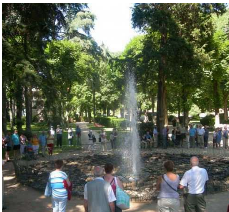
Le Parc du Casino de Vals-les-Bains et sa fontaine intermittente

La ville de Vals-les-Bains (07) a accueilli ce Championnat de France Triplette vétéran.