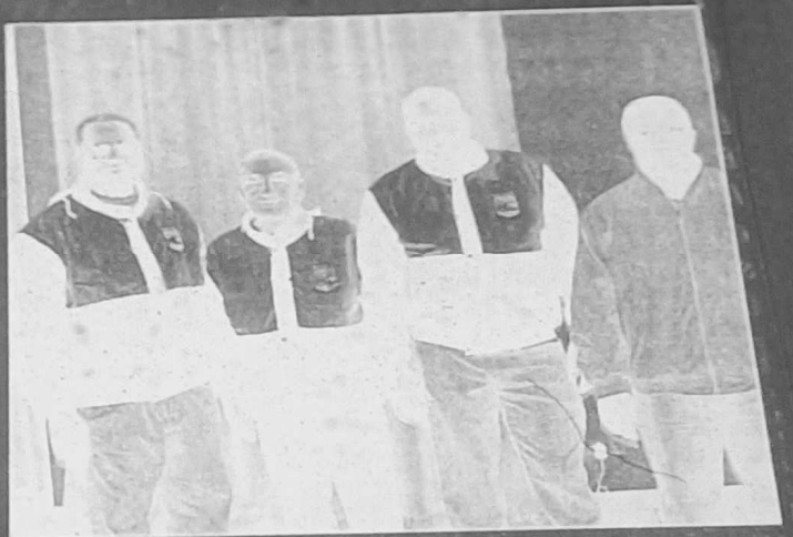
L'équipe de Martinique.

comité d'organisation. Dans la sacoche officielle réservée aux compétiteurs : Une enveloppe "bienvenue à Vals" avec les invitations aux manifestations et aux différentes apéritifs. Une enveloppe hôtellerie avec la publicité sur Vals-les-Bains. Une enveloppe "Restauration" des badges pour les compétiteurs et les délégués. La fiche de poule de chaque équipe, quatre plaquettes du championnat, un dossier de présentation, les revues Rhône-Alpes pétanque, un Dauphiné libéré. En cadeau un magnum séri-