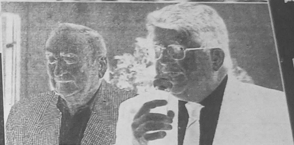
Des bénévoles au service des compétiteurs.