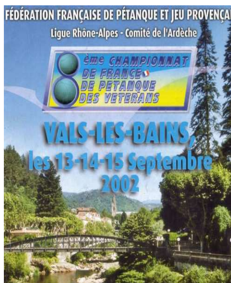
La couverture du programme de ce Championnat vétéran à Vals les Bains.

Cette 11 ème édition chez les vétérans, s'est déroulée les 14 et 15 septembre 2002 avec 125 Triplettes en lice. Ce Championnat vétéran s'est déroulé dans le Parc du Casino , de la cité thermale.