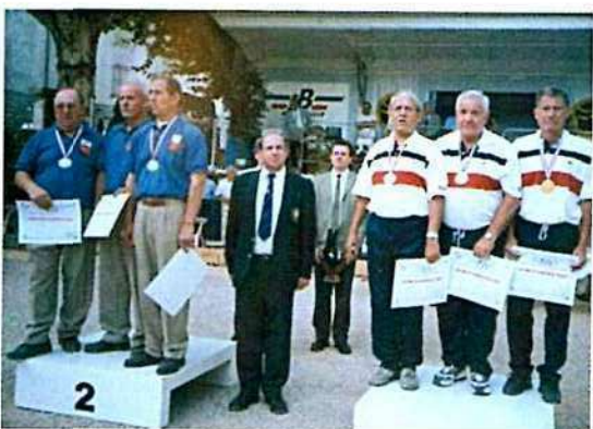
Les champions et vice-champions vétérans

LA MAISON DE LA PÉTANQUE VALLAURIS écomusée