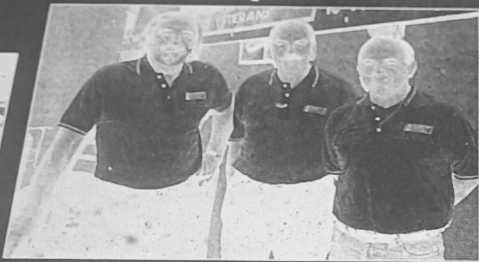
Les responsables de l'organisation.

Un grand week-end sportif attend la cité thermale avec le déroulement dans le parc du Casino du 8 e championnat de France vétérans de pétanque. Une compétition de grande envergure qui va regrouper les meilleurs joueurs, de plus de 60 ans, de l'hexagone ainsi que ceux de la Guyane et de la Martinique.