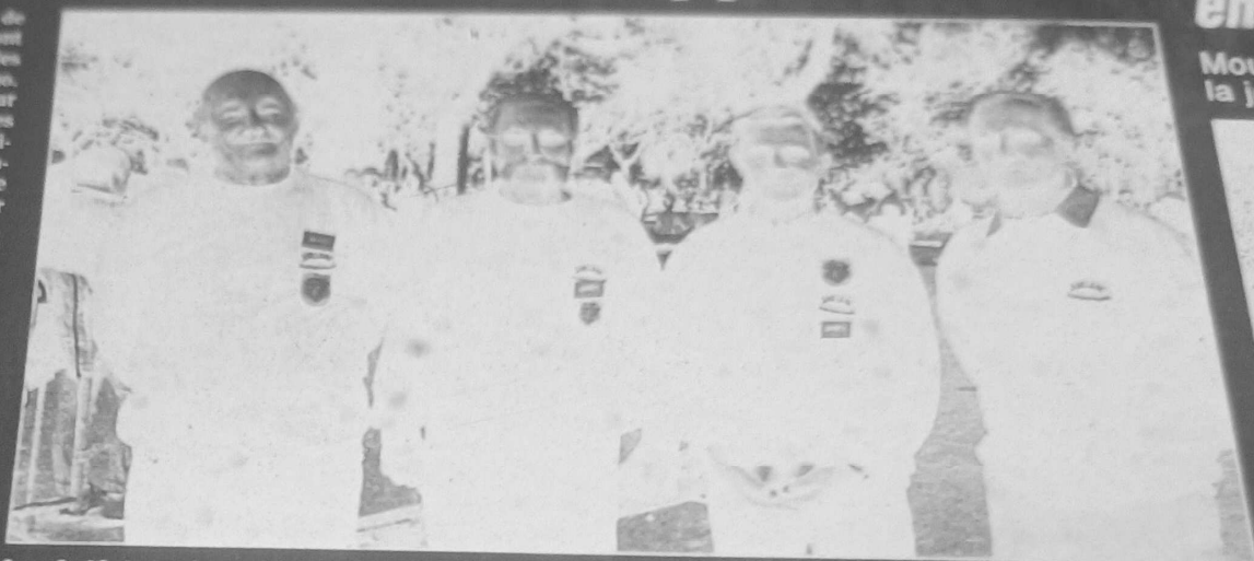
Les Ardéchois étaient bien représentés lors de ce championnat.

Les huitièmes championnats de France vétérans en triplettes ont débuté hier à Vals-les-Bains sur les jeux tracés dans le parc du Casino. Les 124 triplettes qualifiées pour cette compétition ont trouvé des conditions enfin bonnes pour exploiter leur potentiel. En effet, de nombreux participants — dont ceux de la Martinique — craignaient devoir jouer sous la pluie et dans la boue. Et même si les jeux étaient encore humides hier matin, cela n'avait rien à voir avec les jours précédents. Ainsi, la tâche des pointeurs n'était pas rendue trop difficile tandis que les tireurs ne pouvaient rendre les moyennes auxquelles ils sont habitués : même en tombant dix ou 20 centimètres devant la boule tirée, ils n'étaient pas sûrs de réussir une frappe. Dans ces conditions, le jeu n'était pas des plus spectaculaires et le public restait un peu sur sa faim. Sur le plan sportif, la région Sud-Est n'exerce plus la même suprématie que par le passé et on note l'émergence du Nord qui parvient à tirer son épingle du jeu. La meilleure illustration de cette redistribution