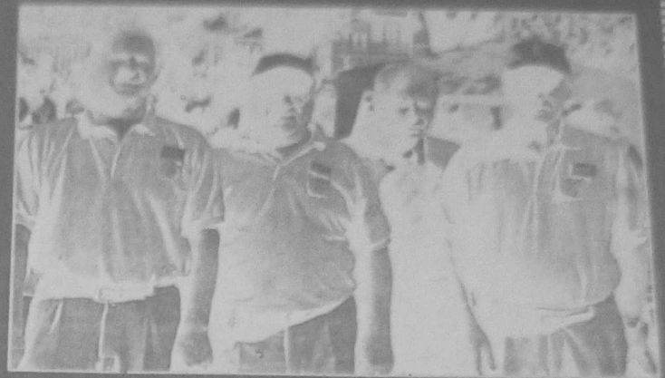
La tripléte Vigneron, vainqueur, et l'équipe Kristo, finaliste.

Les parties finales qui se sont jouées dans le parc du Casino ont attiré une foule compacte (2000 personnes environ).