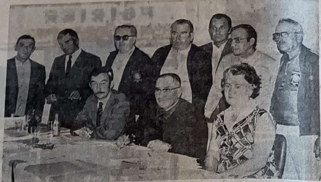
Pendant le tirage au sort

Jeudi après-midi à l'hôtel « Le Continental », au Mans, il fut procédé à un tirage au sort, en vue des championnats de France de pétanque tête-à-tête et doublettes