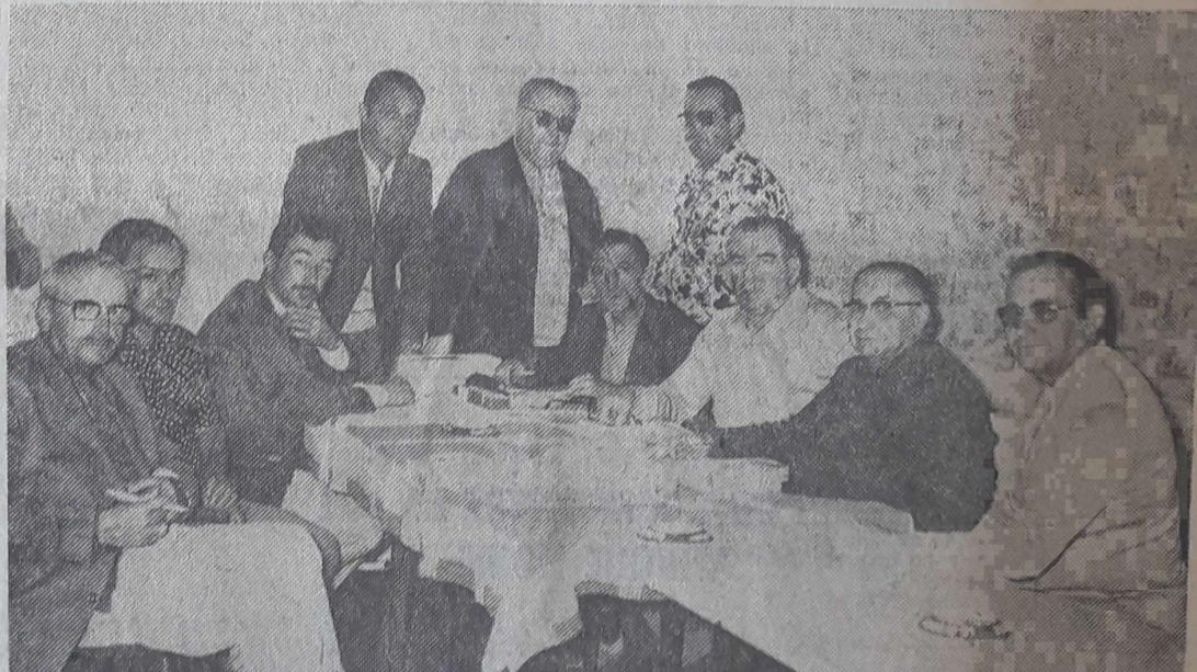
Voici les représentants locaux et de la Fédération à l'occasion du tirage au sort à l'hôtel Continental

Poule 23. — 92, Camus, t. 45; 07, Souche, t. 46; 18, Langevin, t. 45; 36, Balester, t. 46.