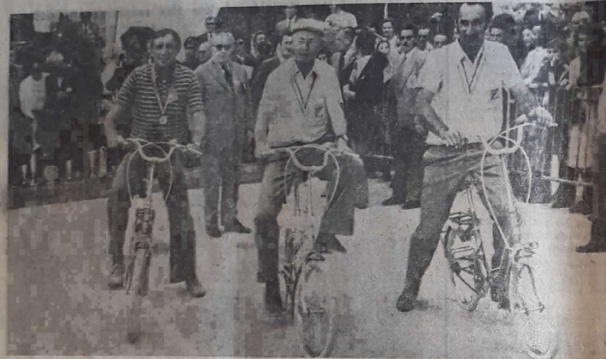
Les vainqueurs, Traswalki (Gard) en tête-à-tête et Chastillon-Montéro (Alpes de Haute-Provence) en doublettes ont gagné chacun, entre autre, une bicyclette pilante. Ils furent incités à jouer les Luis Ocas et à faire un tour d'honneur à bicyclette, sous les ovations du public.