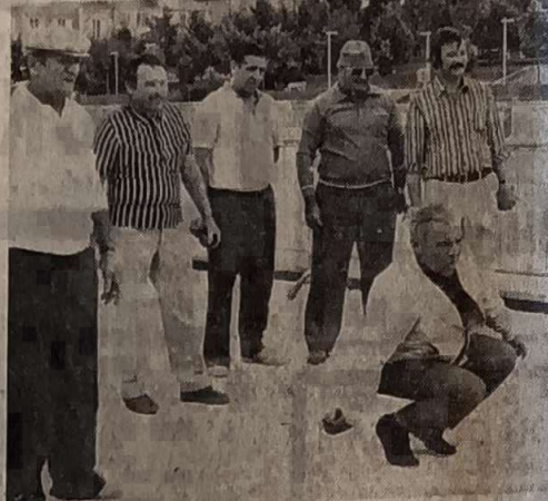
Méridionaux testant le terrain