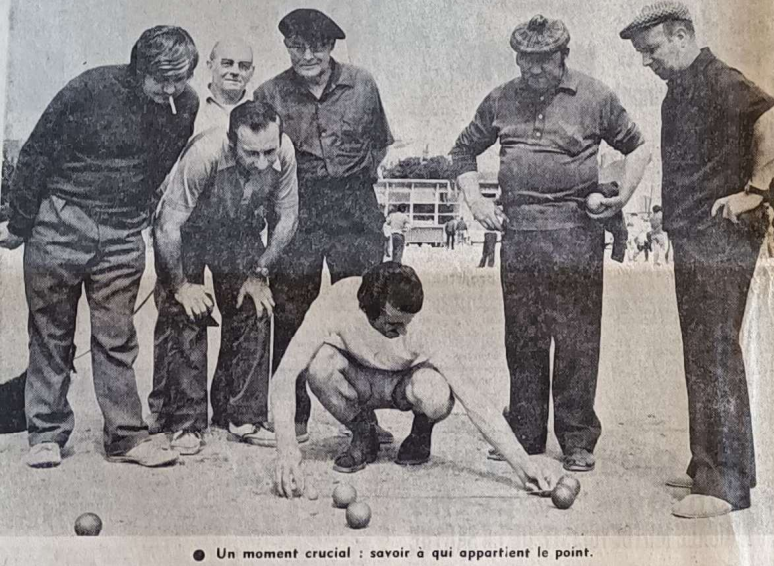
● Un moment crucial : savoir à qui appartient le point.

Seuls quelques-uns semblent irréductibles, mais ils y viennent doucement. Chaque département a son comité qui est affilié à la fédération française de Pétanque et Jeu Provençal les règles n'ont rien à envier, par leur sévérité, aux autres sports : un joueur qui emploie des boules truquées risque 15 ans de suspension.