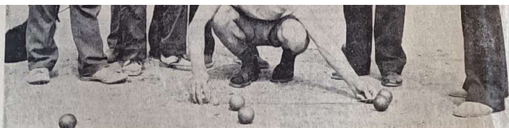
● Un moment crucial : savoir à qui appartient le point.