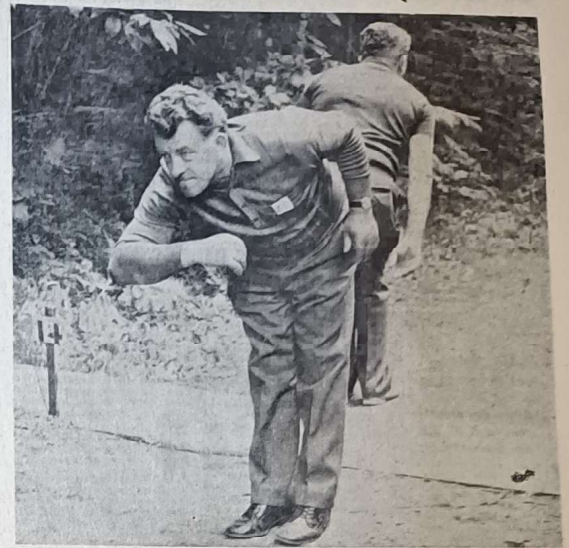
● Adresse, souplesse et sang-froid, telles sont les qualités d'un bon joueur de pétanque.

La pétanque est devenue une véritable institution, qui n'a dans le coffre de sa voiture quelques paires de boules qu'on sort à la première occasion venue, au cours des arrêts de la promenade dominicale - ce qui n'est ni vraiment un sport mais bien plus qu'un jeu - mobilise, tous les dimanches de la belle saison, des milliers de joueurs qui s'opposent en combat singulier ou bien en doublettes, triplées et quadrettes. La pétanque est maintenant représentée dans presque tous les départements.