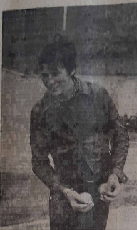
Je me « la » tire ou je me « la » pointe !