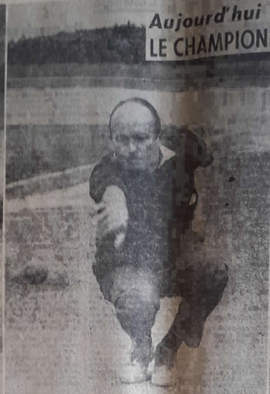
Une bonne boule ! celle-là