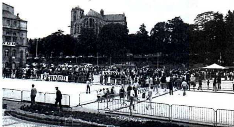
Vue générale des jeux qui ont été parfaitement organisés sur la magnifique "Promenade des Jacobins", au pied de la Cathédrale et des quartiers anciens.