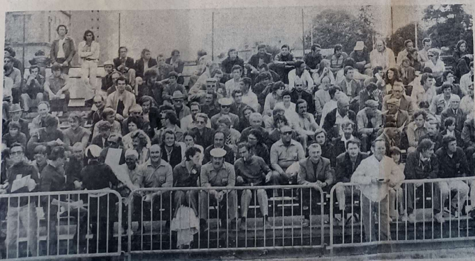
La foule — estimée à plus de 1 500 spectateurs — a suivi avec passion les finales