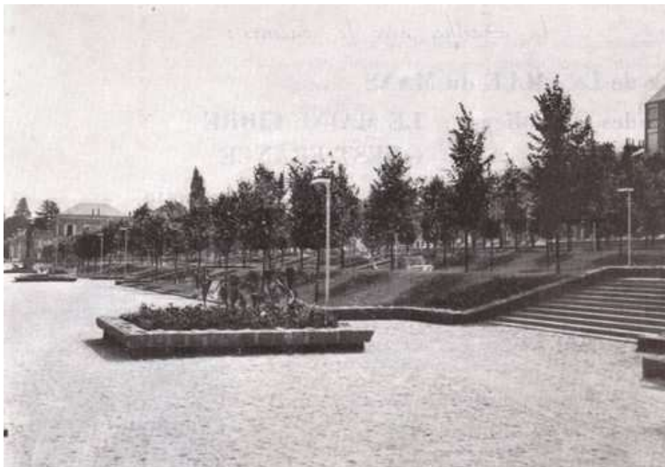
La promenade aux Quinconces des Jacobins du Mans, où s'est déroulé ce Championnat de France

Ce Championnat de France Tête-à-tête senior pétanque , s'est déroulé les 21 et 22 juillet 1973 au Mans (72).