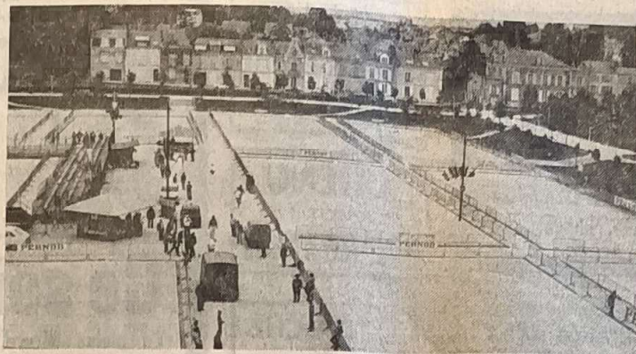
Une vue d'ensemble des quinconces aménagés

Sur les quinconces des Jacobins, il régnait, hier, une intense activité : les responsables du comité départemental de Pétanque, aidés, en cela, par les services municipaux, mettaient la dernière main aux préparatifs des 4 es championnats de France de Pétanque.