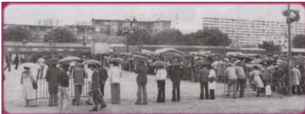
Une vue générale des terrains de ce Championnat 1978 à Bagneux, sous la pluie

Malgré ce mois de juillet, la météo n'a pas été clémente et une pluie fine a rendu les terrains très boueux .