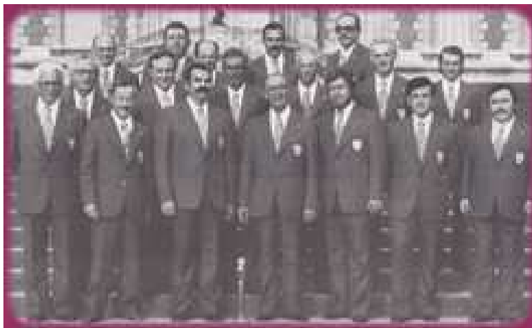
Le Comité d'Organisation de ce Championnat de France à Bagneux en 1978

L' arbitrage de ces 2 journées sportives était assuré par Mrs :