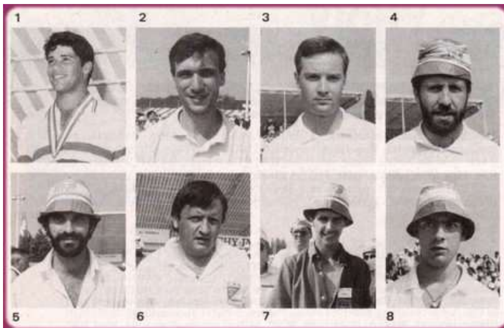
Les 8 joueurs 1/4 de finaliste de ce Championnat de France à Vichy :