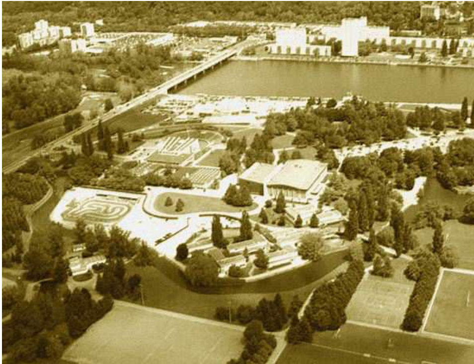
Le Centre Omnisports Pierre Coulon (Maire de Vichy), qui a accueilli ce Championnat de France en 1987

Ce Championnat de France Tête-à-tête senior pétanque , s'est déroulé les 4 et 5 juillet 1987 à Vichy (03).