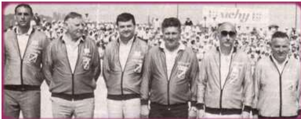
Les arbitres de ce Championnat de France en 1987 à Vichy

Quelques joueurs favoris de ce Championnat à Vichy en 1987 :