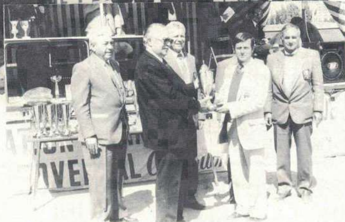
Le passage du flambeau

• Les championnes en titre sont opposées à Sarda-Coros de l'Hérault, championne de la ligue Languedoc-Roussillon. Une partie dont on attend beaucoup tant la prestation des deux équipes avait été excellente au cours des tours précédents. Malheureusement l'équipe Seine-et-Marnaise d'emblée ne trouvera pas son rythme et les joueuses de l'Hérault prirent rapidement un