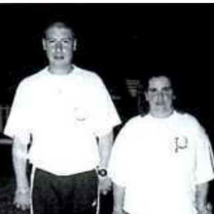
Les 2 Doublettes mixte 1/2 finalistes de ce Championnat de France pétanque 1999