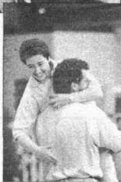
Le titre est acquis...

Finale : Gelin - Radnic bat Millei-Millei 13-9.