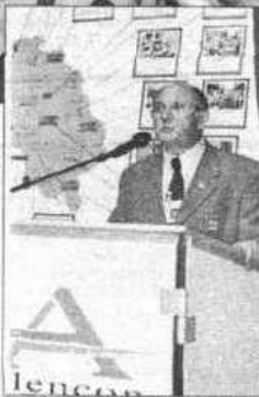
Un président de comité heureux !