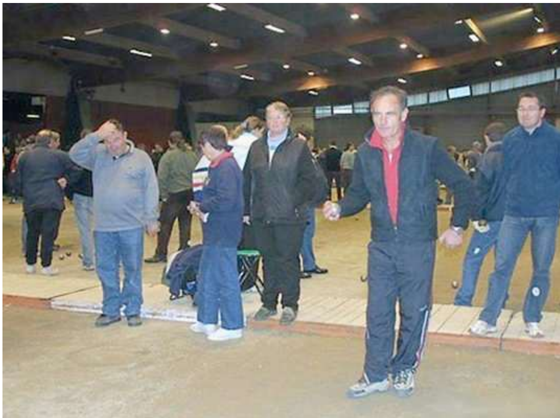
C'est dans l'enceinte du Parc des Expositions et à l'intérieur de ce Parc Elan à Alençon, que s'est déroulé ce Championnat mixte

Ce Championnat de France Doublette mixte s'est déroulé à Alençon (61).