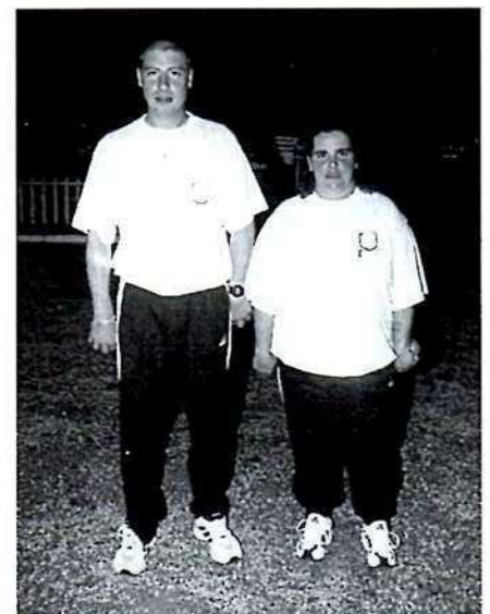
L'autre équipe demi-finaliste.