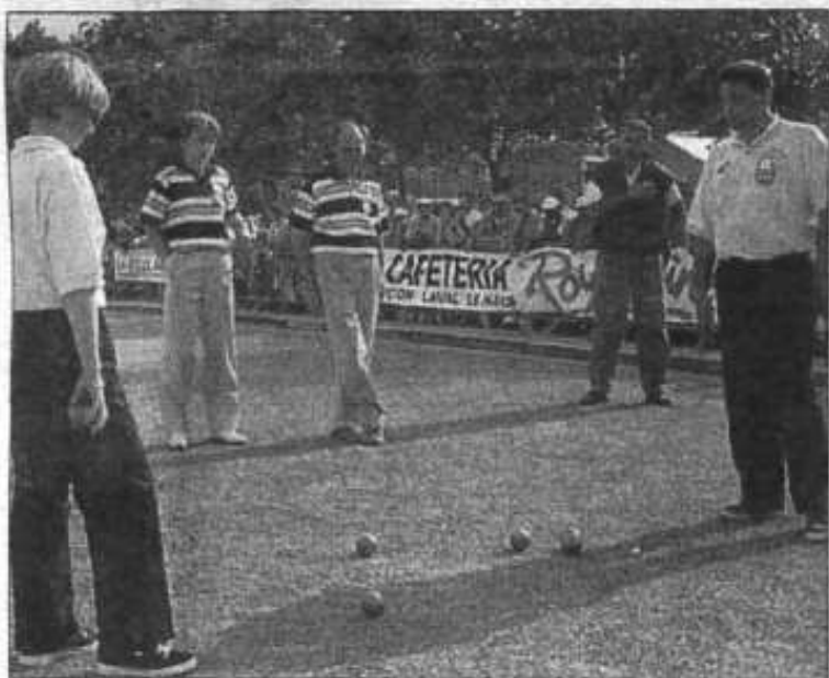
À la conquête d'un titre national, cela demande un maximum de concentration.