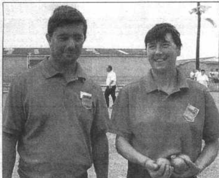
La doublette au masculin-féminin, c'est aussi un chouette sourire aux pays des carreaux et pointes averties.