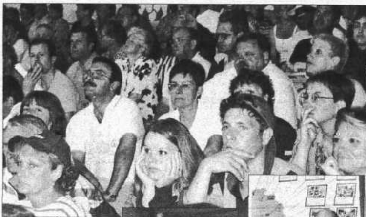
Le public a suivi en nombre l'événement...

Le dimanche, la finale ne réservait pas de surprise. On deux doublettes favorites. Le duo Millei-Millei, malgré un bon départ (6-0 à la 3 e mène), se faisait grignoter par la paire