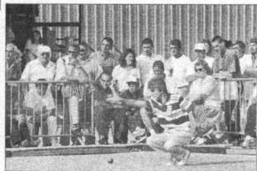
La précision du geste est indispensable