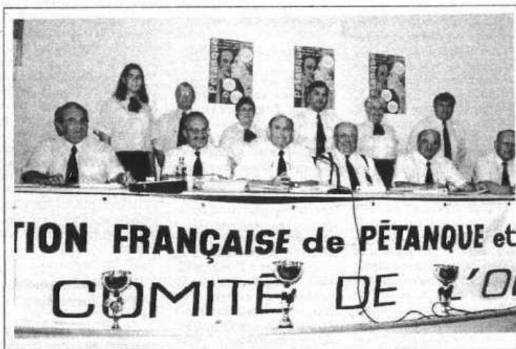
Le comité de l'Orne a travaillé de longs mois à l'organisation de l'événement

Qualifiés pour la deuxième fois, les champions locaux accumulent tout de même les titres de champions de l'Orne et vice-champions de ligue. "La première fois qu'on a participé aux championnats de France, à Villefranche-sur-Saône, on avait juste passé