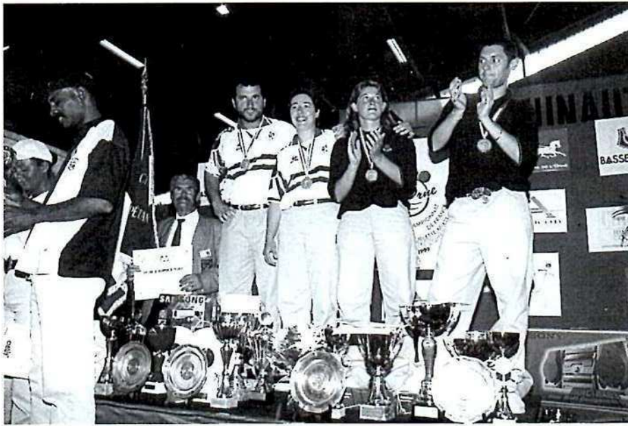
Champions et vice-champions du même club !