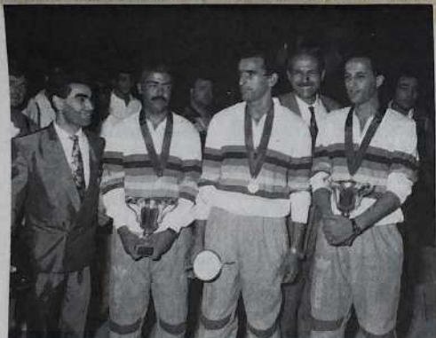
Maroc 1, champions du Monde 1990.

On n'est pas surpris de trouver en lice les deux excellentes équipes de Madagascar, dont on a mesuré la belle prestation durant ces deux premières journées, ni celle de Guinée 1, très remarquée également. Naturellement la belle et célèbre équipe de Monaco 1 est de la fête aux côtés des équipes Marocaines, Espagnoles et Françaises.