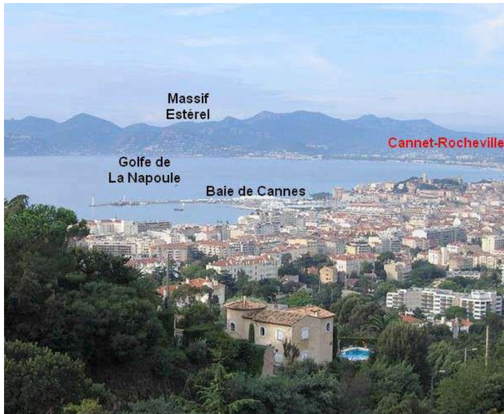
La ville du Cannet, qui domine la baie de Cannes, avec son magnifique panorama sur le Massif de l'Estérel et le golfe de la Napoule

Ce Championnat de France Doublette senior , s'est déroulé les 7 et 8 juillet 1990 au Cannet (06).