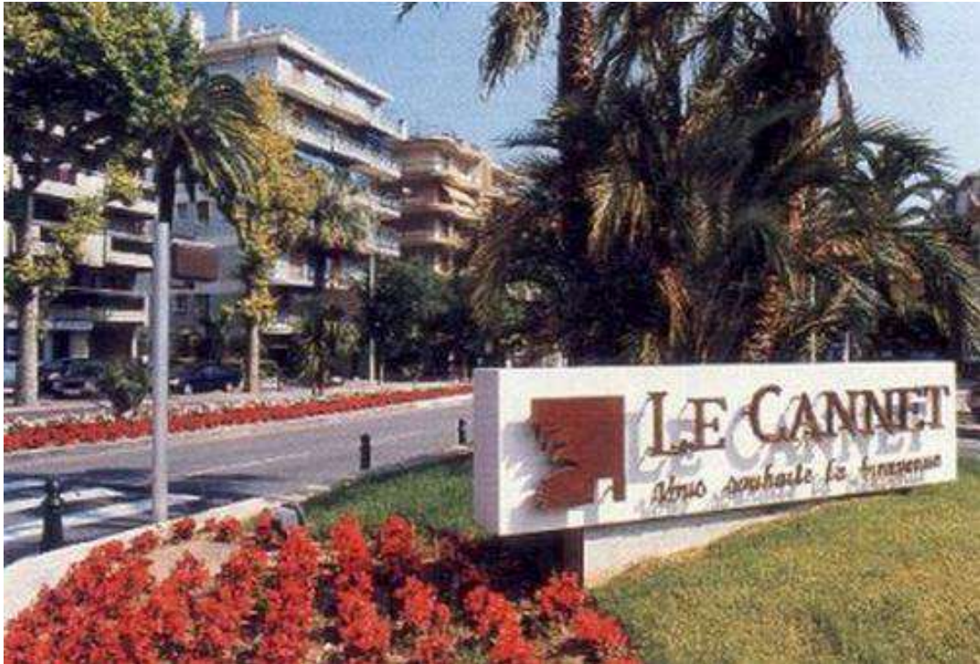
La ville de Cannet qui a accueilli ce 1er trophée national corporatif

Le 1er Championnat de France corporatif Triplette , en 1978 à Cannet (06), aura été en fait le 1er Trophée National corporatif (jusqu'à sa 3ème édition en 1980).