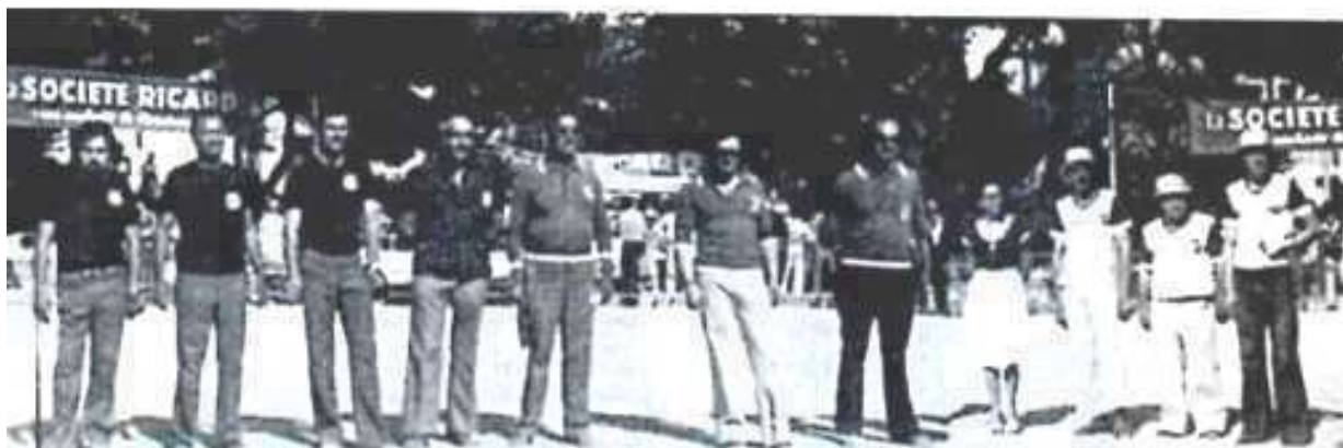
Présentation des équipes Finalistes : à gauche les Vauclusiens, à droite les Nordistes, au milieu le corps arbitral