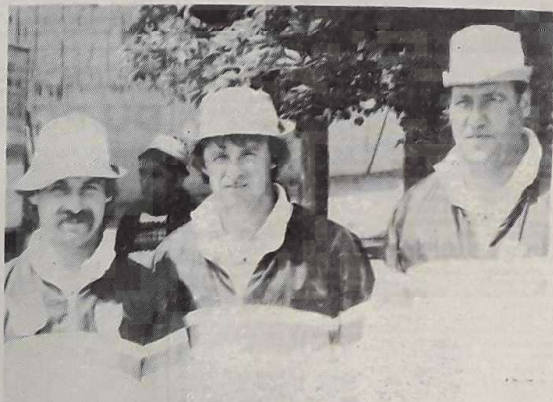
Le Cher a fait bonne figure, allant jusqu'en quart de finale