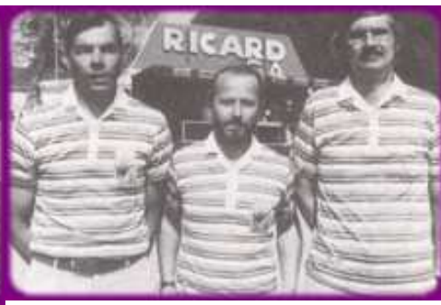
Les 2 Triplettes 1/2 finalistes de ce Championnat corporatif