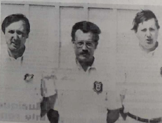
Inesta-Sevestre-Nardoux, la meilleure équipe du Loiret

Orléans. — « Ce n'est pas mal, mais cela aurait pu être mieux », ce constat s'appliquait bien aux équipes du Loiret.