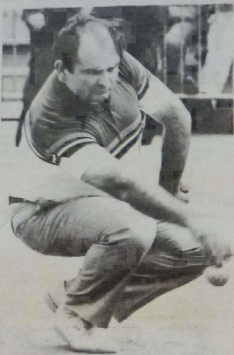
La concentration, une importance déterminante.

Durant la journée du samedi les festivités commencent par les matches de poule. Les équipes orléanaises allaient connaître des fortunes diverses, deux se faisaient éliminer dès le premier tour, l'une par une équipe de Haute-Corse et l'autre par l'équipe de Haute-Garonne qui n'ira pas très loin dans la compétition. La troisième équipe du Loiret passait ce