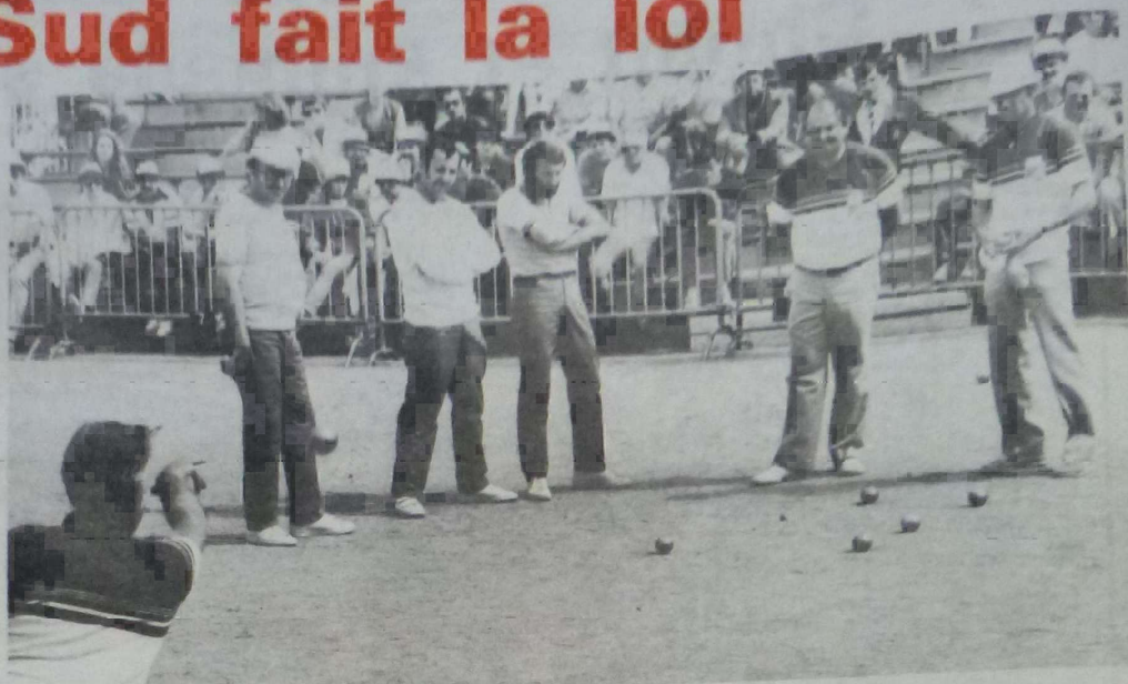
Les deux équipes finalistes face à face.

tour, mais se faisait éliminer au tour suivant lors des cadrages par l'équipe de l'Ariège sur le score sans appel de 13-3. Malgré tout l'équipe P.T.T. du Loiret se voyait attribuer la coupe du département non pas pour sa performance mais parce qu'elle s'est distinguée vis-à-vis de ses deux rivales.