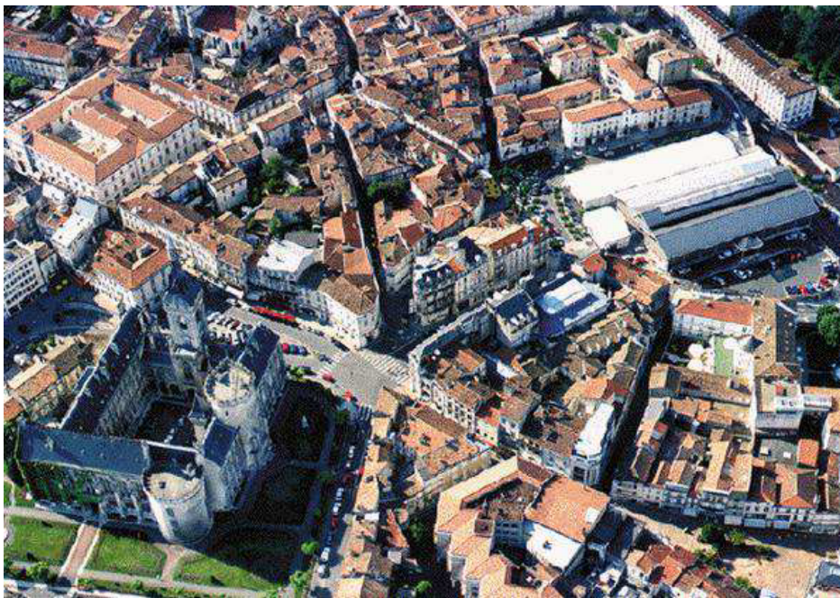
Vue aérienne de la ville d'Angoulême, en Saintonge, à gauche le château des Comtes d'Angoulême, devenu l'Hôtel de Ville

Ce Championnat de France corporatif , s'est déroulé à Angoulême (16) les 20 et 21 juin 1987.