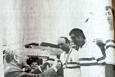
Le président de la Fédération remet les médailles aux champions, l'équipe Gers

Le titre est revenu à l'équipe de Rochefort