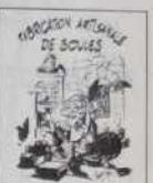
Ref.: T 08