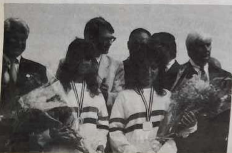
Championnes de France.