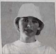
Bob - Ref. C03 blanc/bleu - blanc - bleu marine blanc/rouge - noir - rouge 25 francs ou 2 bons parrainage