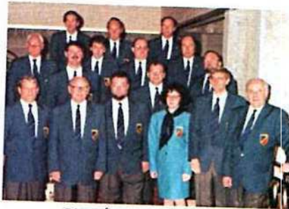
COMITÉ DE SEINE-MARITIME

Malgré la pluie incessante le terrain était resté jouable : le goudron recouvert de gravillons du parc des expositions était souvent en pente et plein de revers, ce qui favorisait l'écoulement de l'eau.