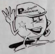
Dessin figurant sur les 3 articles ci-contre

Tailles : S / M - L - XL : 80 Francs ou 8 bons parrainage de 2 à 14 ans : 60 Francs ou 6 bons parrainage