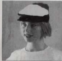
Casquette bouliste - Ref. C01 multicolore ou blanche 30 francs ou 3 bons parrainage