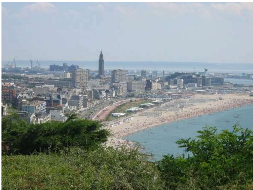
La ville du Havre en Seine-Maritime, qui a accueilli ce Championnat de France corporatif

Ce Championnat de France corporatif , s'est déroulé au Havre (76) les 20 et 21 juin 1992.