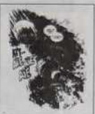
Ref.: T 07