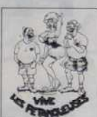
Ref.: T 04