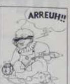
Ref.: T 05