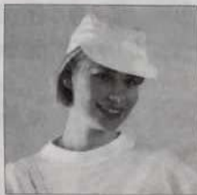
Casquette base-ball - Ref. C02 blanche, blanc/jaune blanc/bleu, blanc/rouge, orange 15 francs ou 1 bon parrainage