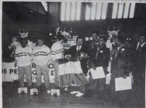
Les finalistes à la remise des prix

Dans les demi-finales, les quatre équipes semblaient pouvoir gagner