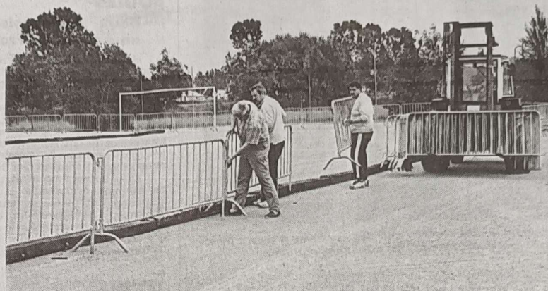
Tant à La Ponétie qu'à Baradel, où sera en place le « carré d'honneur », les préparatifs ont été bon train afin qu'Aurillac accueille au mieux ces championnats de France de pétanque.