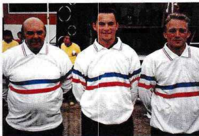
Les champions de Seine-Maritime