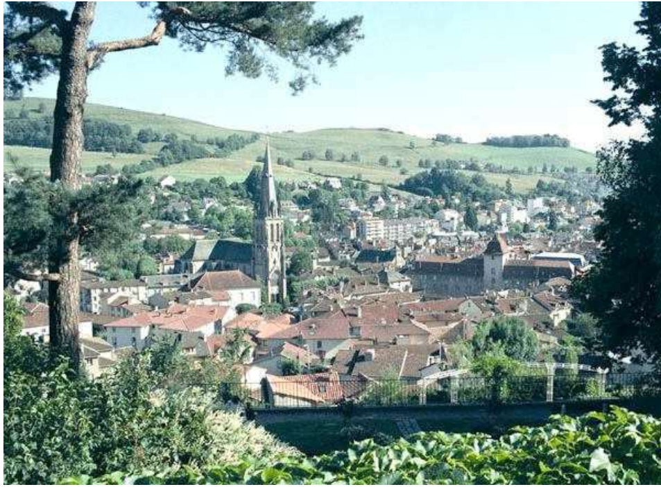
La ville d'Aurillac, qui a accueilli ce Championnat de France corporatif en 1995

Ce Championnat de France corporatif , s'est déroulé à Aurillac (15) les 17 et 18 juin 1995.