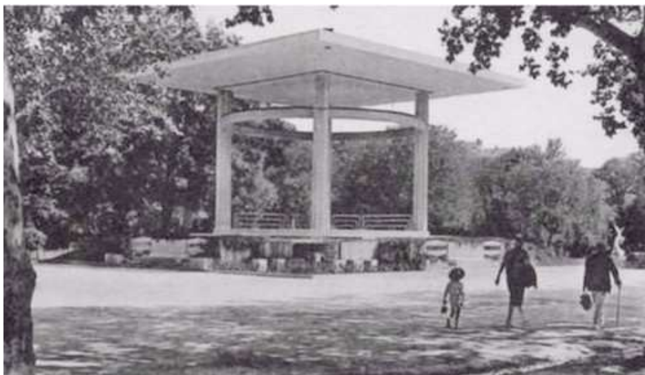
Le kiosque Bosc, sur l'Esplanade Charles de Gaulle, où fut installé le graphique, durant ce Championnat