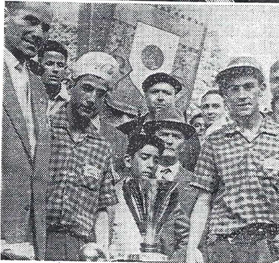
En haut : L'équipe SAURA, qui a enlevé le championnat de première catégorie. Au-dessous : L'équipe HAGIOFITIS, champion dans la catégorie juniors, vient de recevoir la coupe.