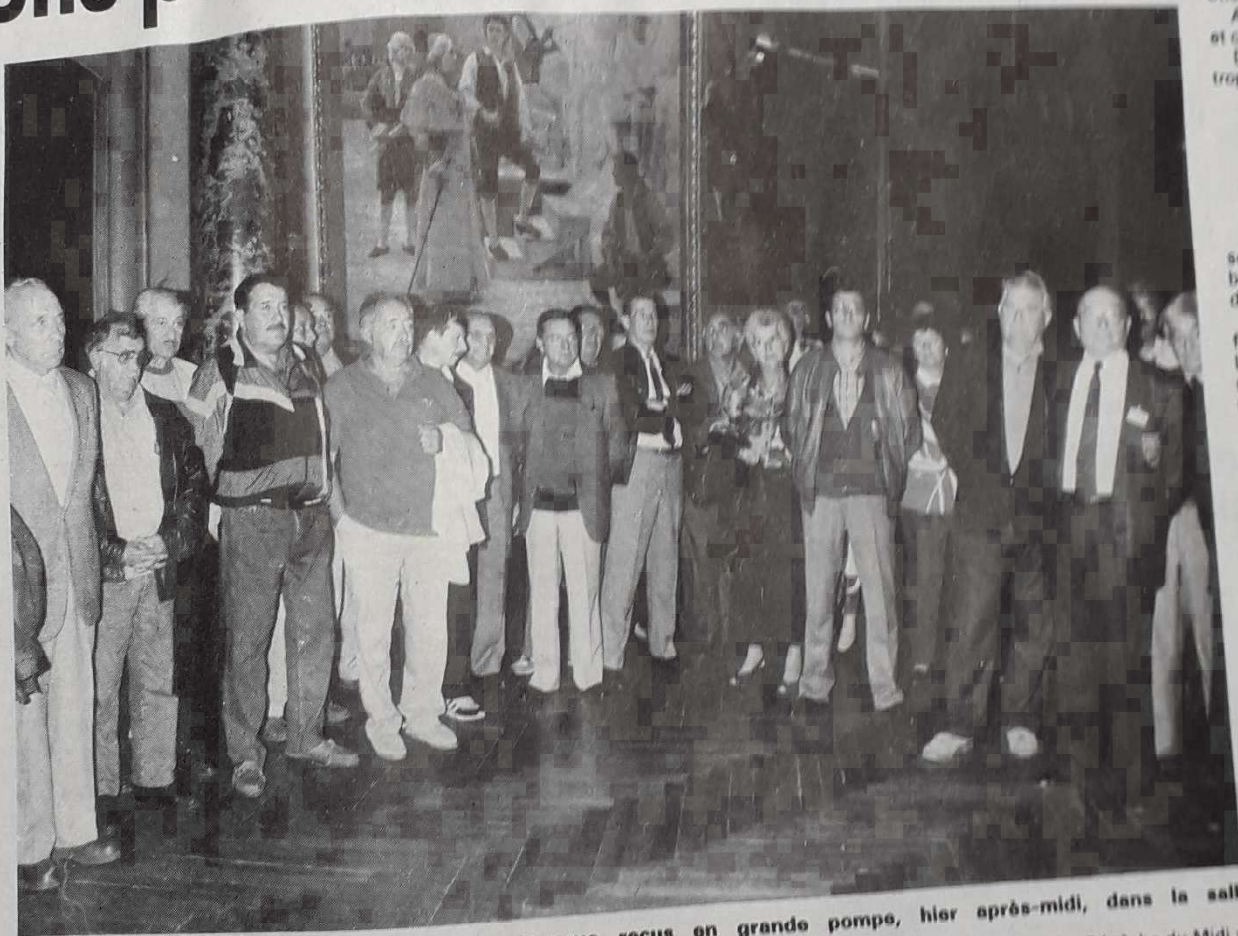
Les participants au premier National de pétanque reçus en grande pompe, hier après-midi, dans la salle des Illustres de la mairie de Toulouse.