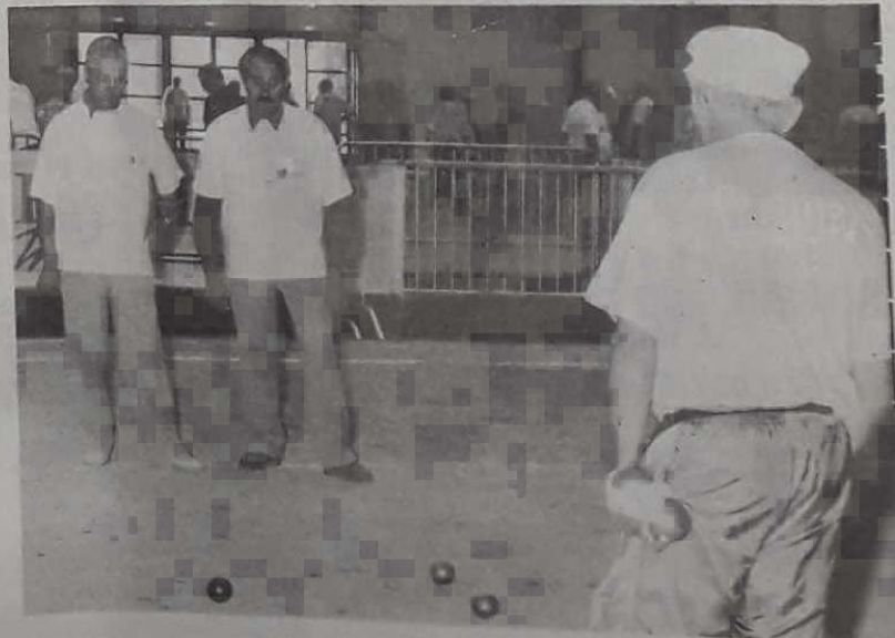
Celle-là, il va falloir que tu la tires...