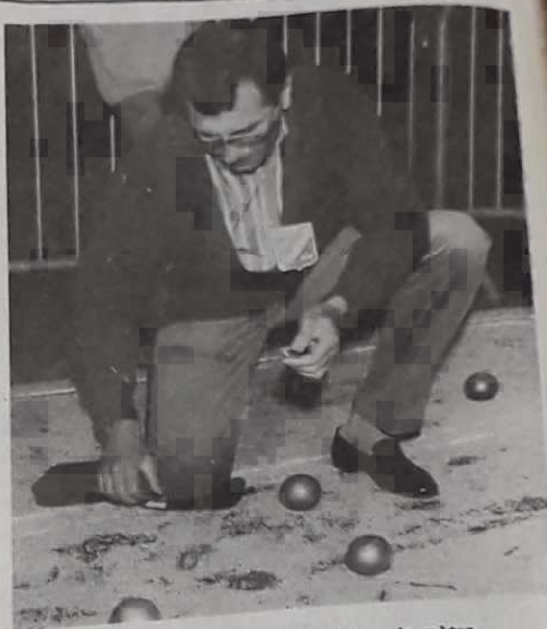
L'arme impitoyable de l'arbitre : le mètre.