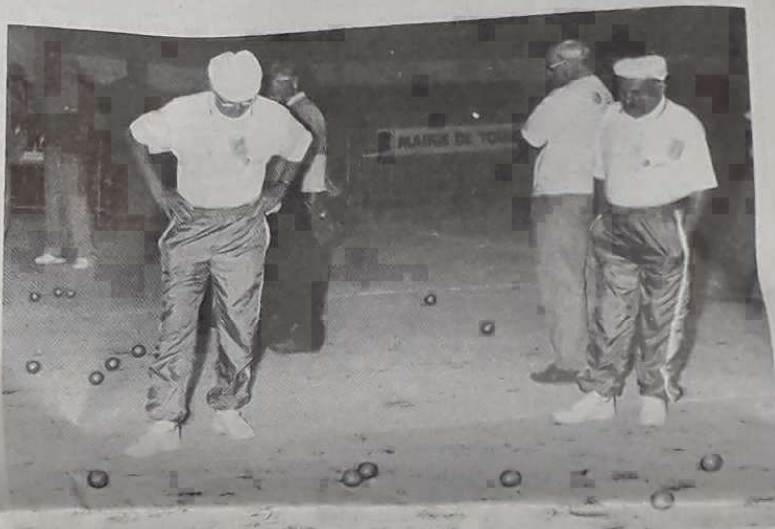
... en voici encore la preuve.