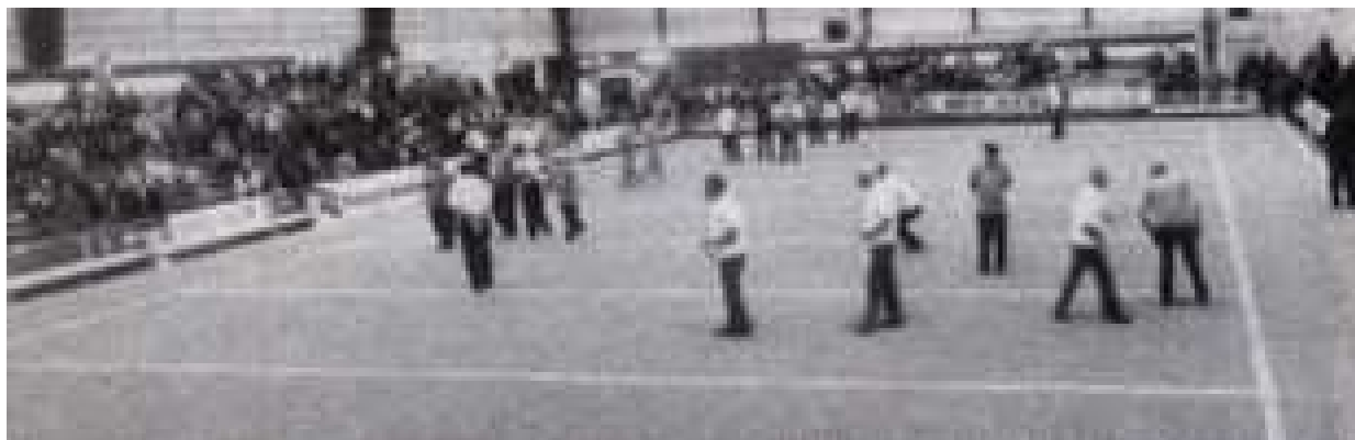
Une vue des 1/8 de finale de ce trophée National vétéran dans le carré d'honneur