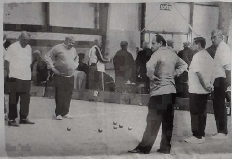
L'âge n'enlève rien à la qualité du jeu et à la précision des coups...

Le succès est au rendez-vous du Palais des congrès de Toulouse. Un concours de la trempe des grands. Aujourd'hui les finales.