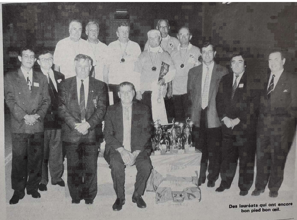
Des lauréats qui ont encore bon pied bon œil.

Voir les résultats en pages sportives générales