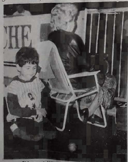
Si jeune et déjà sous l'emprise de la boule...