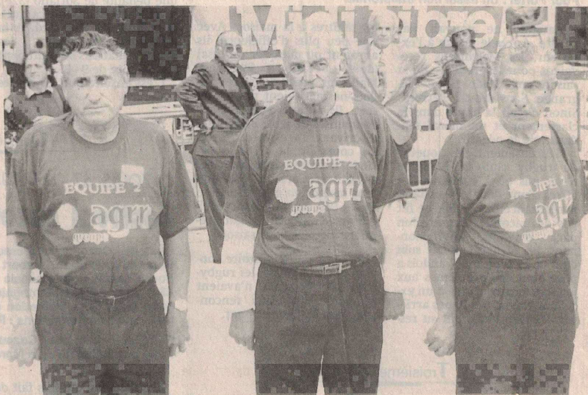
Les lauréats d'un championnat de France d'excellente tenue.

Auparavant, en demi-finale, les Marseillais avaient éliminé leurs collègues des Bouches-du-Rhône emmenés par le