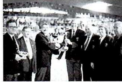
Ci-dessus de haut en bas.