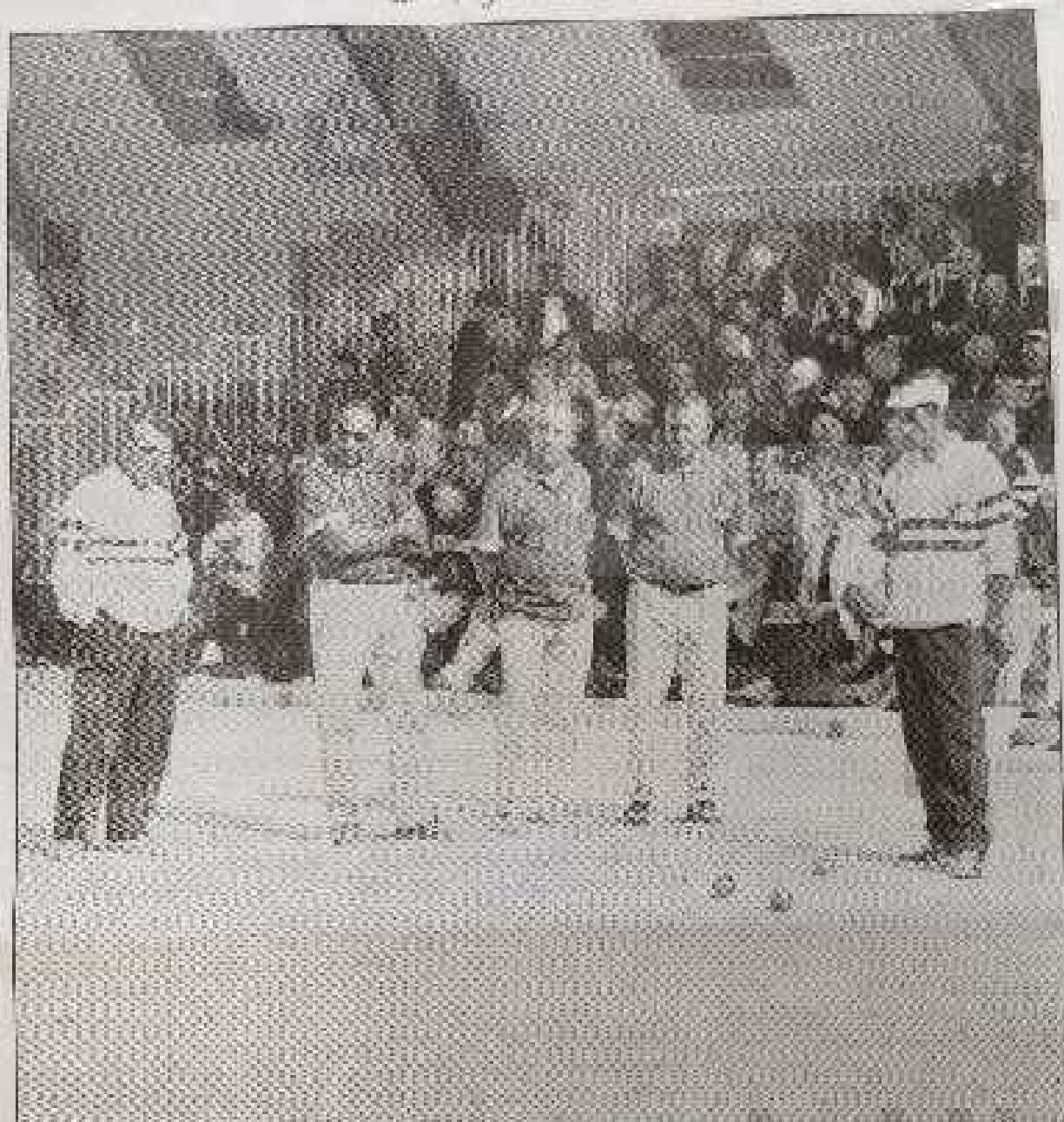
Voujeaucourt, capitale des vétérans.

128 équipes de vétérans ont disputé le championnat de France à Voujeaucourt.