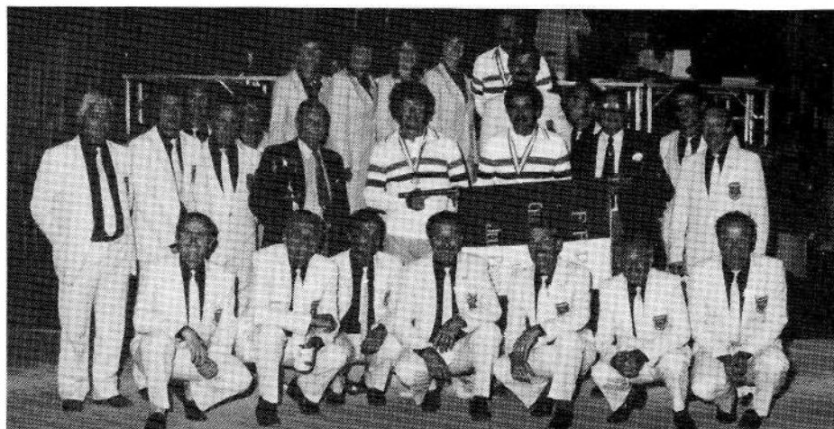
Le Comité de l'Isère à Grenoble

Après le Grand Prix qui a eu lieu à Roussillon le 2 septembre (concours qui connut un succès exceptionnel avec la présence de près de 600 joueurs).