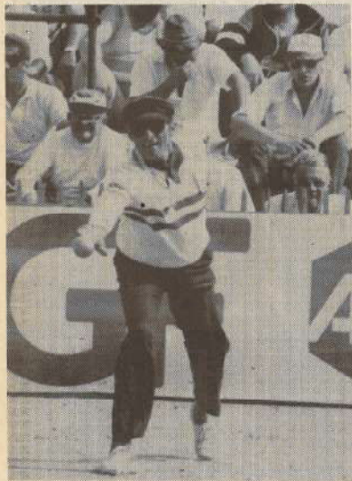
Lafleur au point pour un troisième titre consécutif