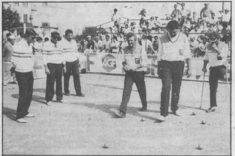
Pendant la finale