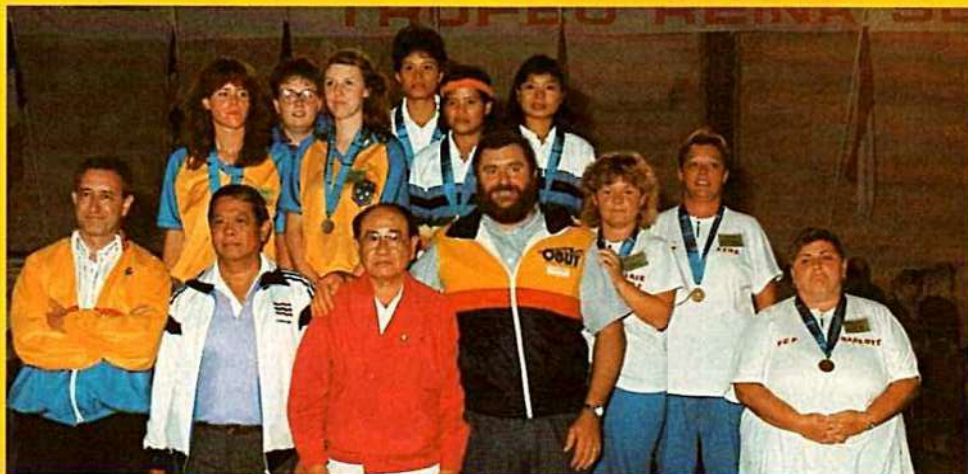
Championnes du Monde THAÏLANDE, 2 e SUÈDE, 3 e CANADA.