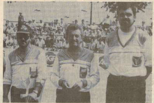
La triplette de Griseri à long temps inquiété Lafleur pour le titre, mais en vain.

mène, le point de la victoire étant inscrit par Lafleur qui remportait là son troisième titre d'affilée. Une première dans l'histoire du jeu provençal. Ludovic DAIM ■ Résultats : Quarts de finale. — Griseri Victor Sabetti (83) battent Simon Martin Dalmasso (13) par 13 à 6 ; Astesan Farnet Berdon (83) battent Giorgi Flores Abeille (13) à 13 à 7 ; Lafleur Capelle Angelvin (04) battent Guerrieri Lovisolo Careo (84) par 13 à 6 ; Benza Garnier Soeng (13) battent Salle Demirjan Bandini (83) par 13 à 9. Demi-finales. — Lafleur Capelle Angelvin battent Astesan Farnet Berdon par 13 à 6 ; Griseri Victor Sabetti battent Benza Garnier Soeng par 13 à 3. Finale. — Lafleur Capelle Angelvin battent Griseri Victor Sabetti par 13 à 12.