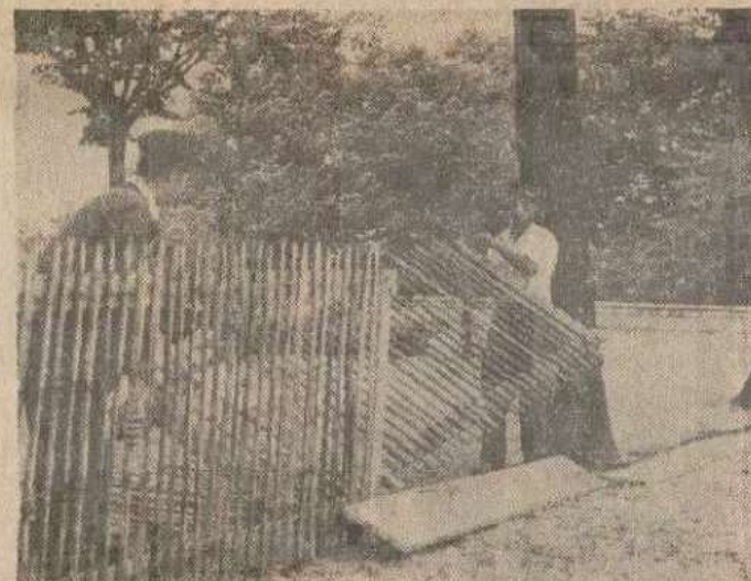
Le démontage de l'installation mise en place pour le championnat a commencé par les barrières de bois. Les tribunes ne viendront qu'ensuite.