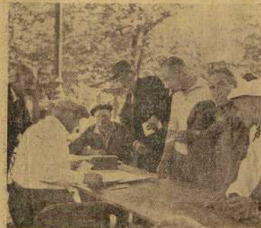
Les dirigeants Drôme-Ardèche s'ajoutent au secrétariat. Les éternels « guillelms ».

Il y eut des réceptions, bien sûr. Ne sont-elles pas faites pour renforcer l'unité ? C'est ainsi qu'en fin de matinée au café des Négociants, la Maison Péc qui patronne ces championnats, avait invité officieusement, d'ailleurs, les dirigeants, les joueurs et les spectateurs. Les uns et les autres apprécièrent comme il se doit cette manifestation amicale qui permit aux représentants de cette firme et aux responsables de la pétanque de manifester leur sympathie.