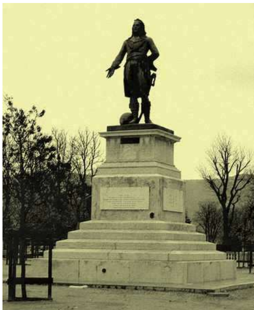
La statue du général Jean-Etienne Vachier, érigée sur le Champ de Mars à Valence, où s'est déroulé ce Championnat

Ce Championnat de France Triplette senior , s'est déroulé à Valence (26) en 1958.