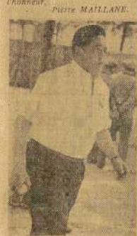
Pipette à Pip-Aubert est aussi excellent pétanqueur du Comité de l'Aude qui triompha du quinze national de rugby à 13.

En bouille... la longue ou la lyonnaise, comme on voudra, ne parvint pas à vaincre le vent et la pluie qui lui avait donné, à Valence, la comédie la plus étrange. C'est donc par une après-midi pluvieuse que furent données les trois coups de ces 17 Championnats de France qui ont pris un départ aussi sympathique que promet.