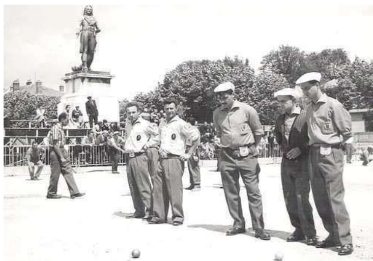
Une vue des parties, durant ce Championnat, au pied de la statue Championnet, du Champ de Mars