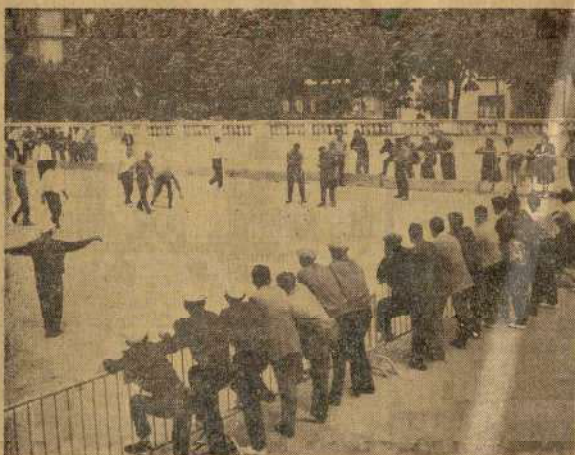
Vue plongeante sur les jeux de la première catégorie durant le déroulement des poules.