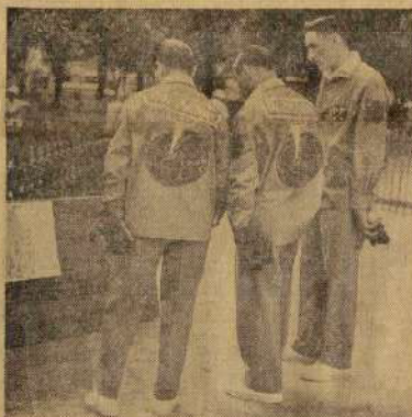
L'effort vestimentaire fut très apprécié au cours de ces championnats. Ténors les pétanqueurs de Marmande qui, très artistement, imitent la richesse de leur région : la tomate.