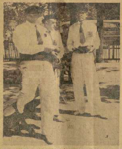
En tenue folklorique de pelotari, les représentants de Pau font grosse impression.

Al Ch Pi Pi La rue Le en Al l'ach Al Gyl rue Ch Hér 19 7 12 C B T S