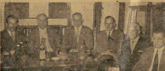
A la réception de « Péc » qui patronne ces championnats.

Longtemps le ciel demeura menaçant durant la matinée et roula des nuages lourds et noirs qui avaient rien de sympathique. Mais, cependant, le soleil ne parvint pas à vaincre le vent et la pluie qui lui avait donné, à Valence, la comédie la plus étrange. C'est donc par une après-midi pluvieuse que furent données les trois coups de ces 17 Championnats de France qui ont pris un départ aussi sympathique que promet.