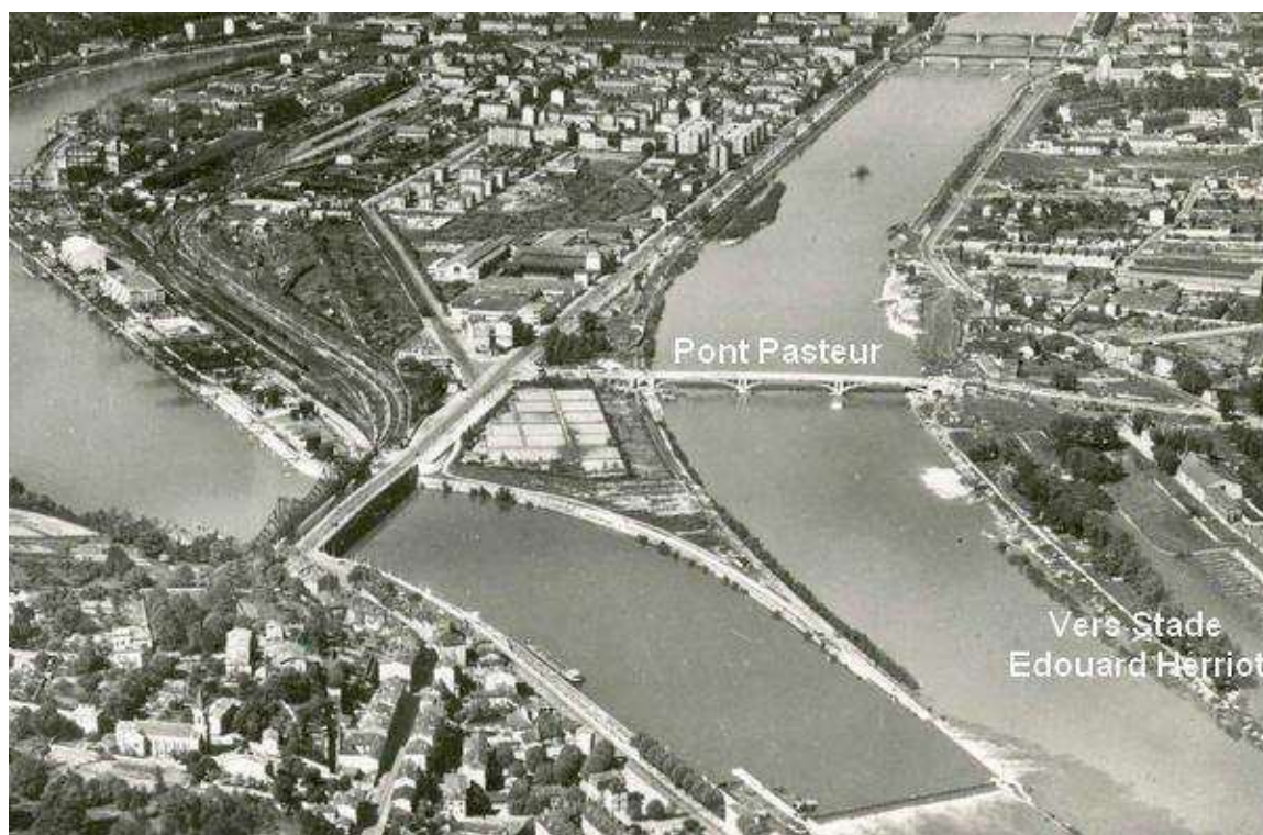
Le confluent de la Saône et du Rhône à Lyon, à hauteur du Pont Pasteur et du stade Edouard Herriot, où s'est déroulé ce Championnat de France

Ce Championnat de France Triplette senior pétanque , s'est déroulé les 14 et 15 septembre 1963 à Lyon (69).