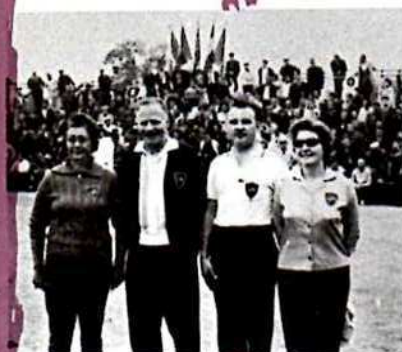
de passage à Lyon, ces quatre champions de pétanque (français) de San Francisco (U.S.A.) sont venus saluer leurs compatriotes