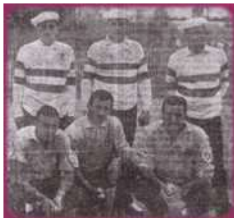
Le 1/8ème de finale, qui a opposé les Champions en titre du (84), face au (65)