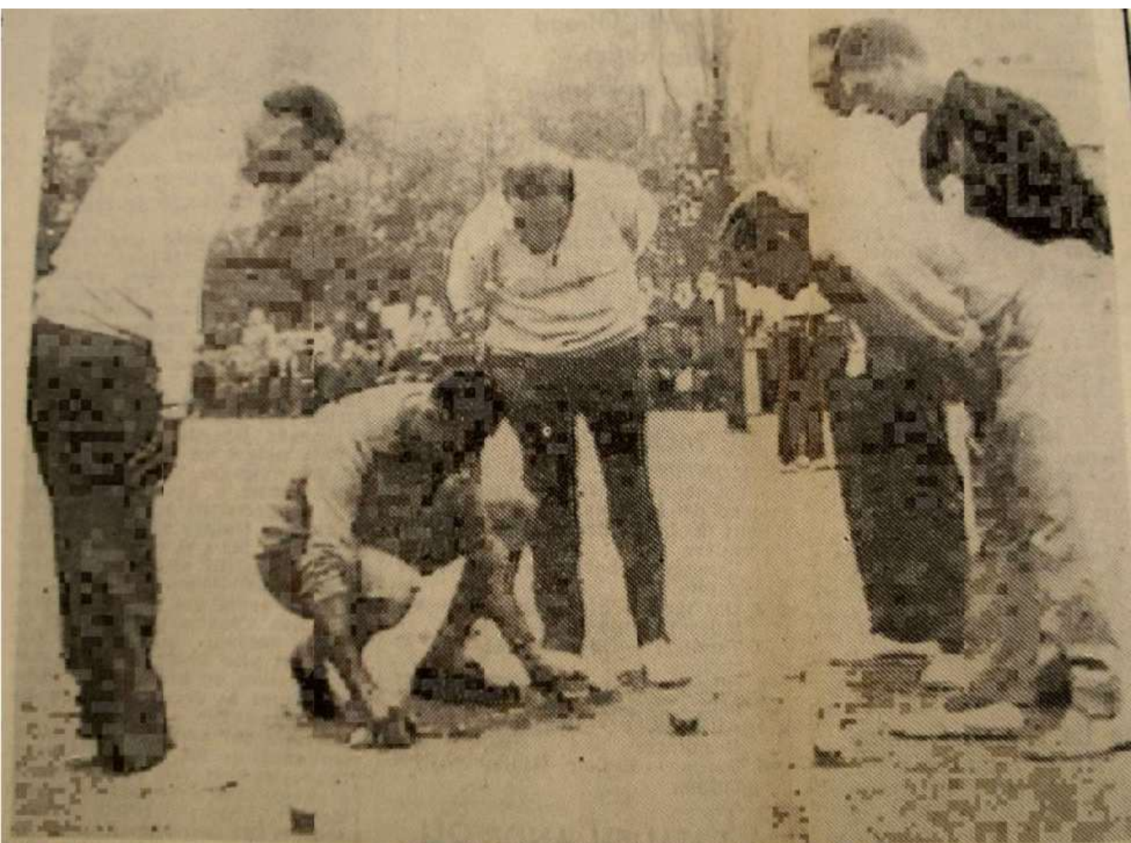
Une phase de la finale entre la formation port-de-boucaine de Broccet et le trio varois de Palag.