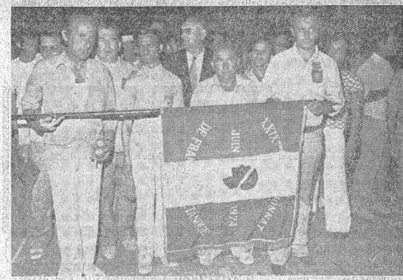
Les finalistes malheureux...