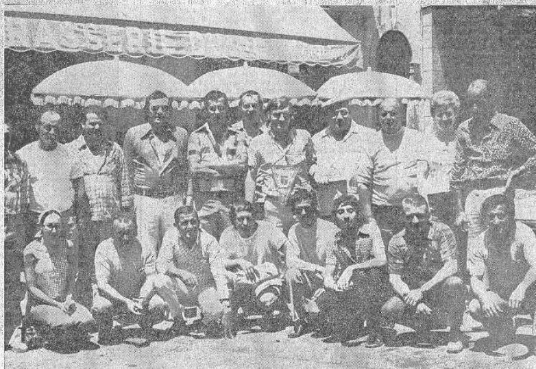
Les joueurs Bastiais et ceux d'Arena Vescovato ont rejoint leurs amis Ajacciens pour la postérité de la Boule Corse.