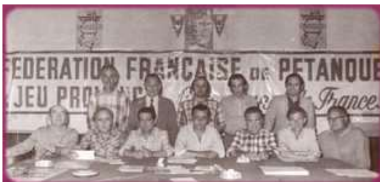
Le Comité d'Organisation Corse de ce Championnat à pétanque en 1974 à Ajaccio