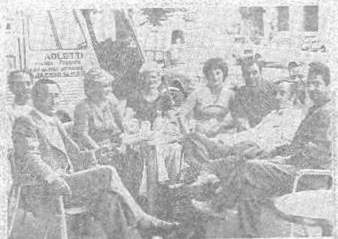
Kokoyan et Sesame : la déception est effacée. Il a pris rendez-vous pour... l'année prochaine.