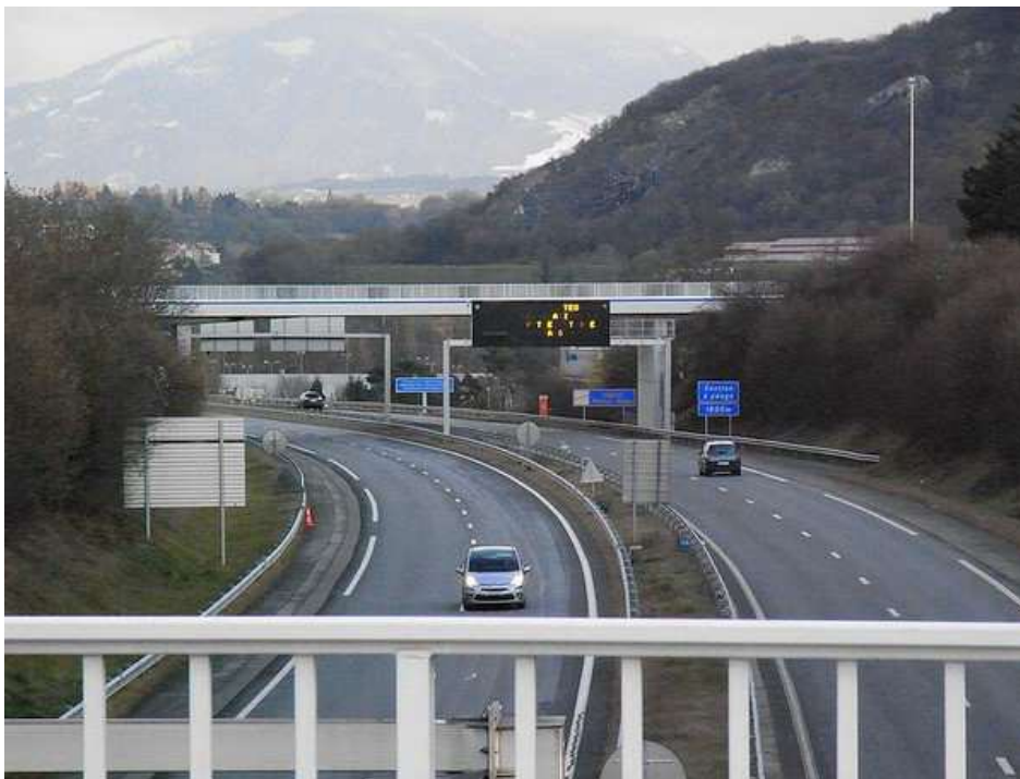
La ville de Gaillard en Haute-Savoie, a la particularité d'être coupée en 2, par l'autoroute Blanche et seuls 3 ponts permettent la communication de chaque côté de cette Bourgade

Ce Championnat de France Triplette junior , s'est déroulé les 26 et 27 août 1989 à Gaillard (74).