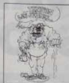
Ref. T 02