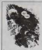
Ref. T 07