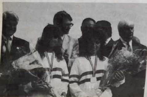
Championnes de France.