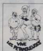
Ref. T 04