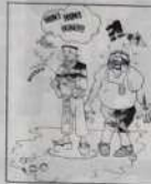
Ref. T 01