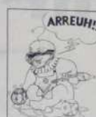
Ref. T 05