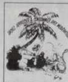
Ref. T 06

Ref. T 01 - L / XL : Blanc, bleu, jaune, fuschia S / M : Blanc, saumon, vert, parme 8/10 ans - 4/6 ans - 2/3 ans : Blanc, saumon, vert, parme Ref. T 02 - L / XL : Blanc, bleu, jaune, fuschia S / M : Blanc, fuschia, saumon, vert, parme Ref. T 03 - S / M - L / XL : 12/14 ans - 8/10 ans - 4/6 ans - 2/3 ans Blanc, saumon, vert, parme Ref. T 04 - S / M et L / XL : Blanc, vert, bleu, rose Ref. T 05 - 2/3 ans - 4/6 ans - 8/10 ans : Blanc, saumon, vert, parme Ref. T 06 - 2/3 ans - 4/6 ans - 8/10 ans - 12/14 ans - S / M - L / XL : Blanc Ref. T 07 - idem ci-dessus Ref. T 08 - idem ci-dessus