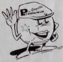
Dessin figurant sur les 3 articles ci-contre

Tailles : S / M - L - XL : 80 Francs ou 8 bons parrainage de 2 à 14 ans : 60 Francs ou 6 bons parrainage