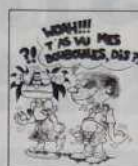
Ref. T 03