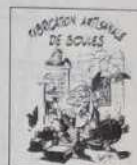
Ref. T 08