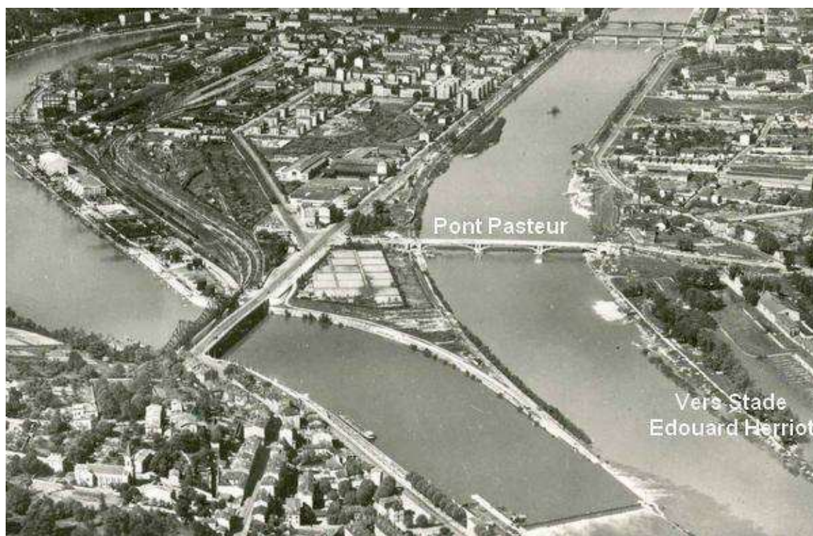
Le confluent de la Saône et du Rhône à Lyon, à hauteur du Pont Pasteur et du stade Edouard Herriot, où s'est déroulé ce Championnat de France

Ce Championnat de France Triplette senior pétanque , s'est déroulé les 14 et 15 septembre 1963 à Lyon (69).