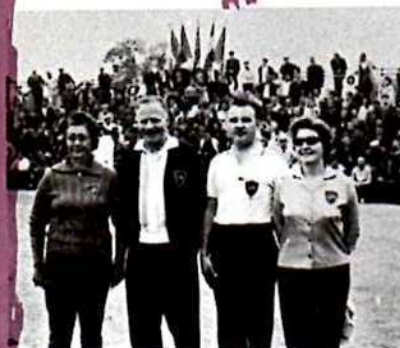
de passage à Lyon, ces quatre champions de pétanque (français) de San Francisco (U.S.A.) sont venus saluer leurs compatriotes

avant la finale, les organisateurs, les autorités et les joueurs sont présentés au public