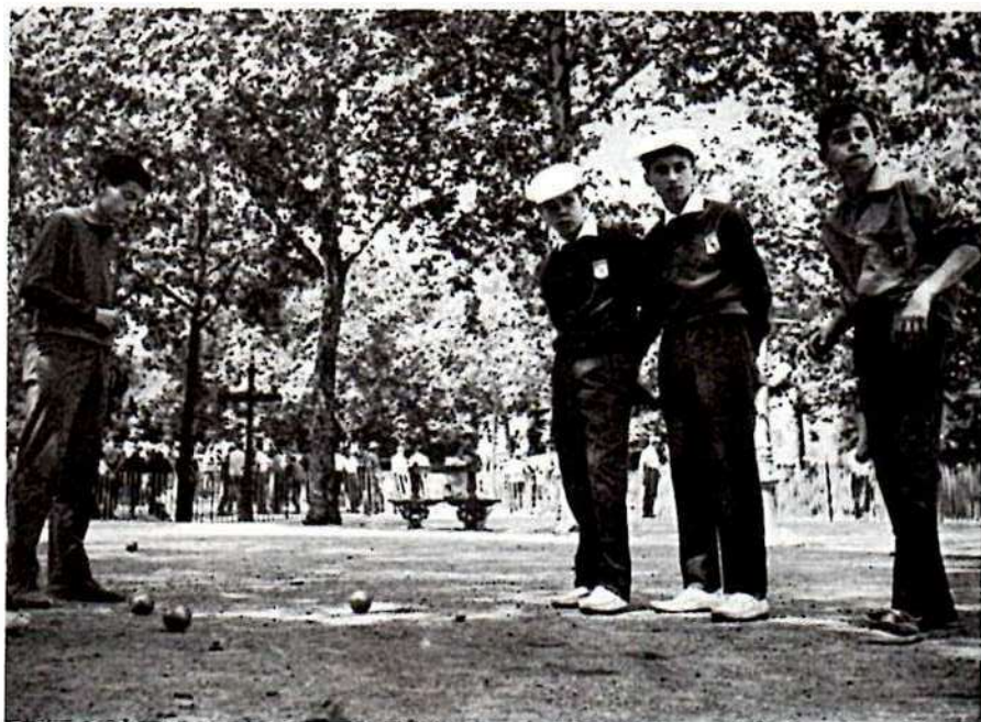
une triplète alsacienne sous les ombrages va reprendre le point.