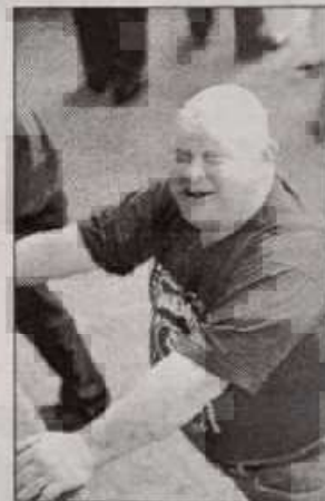
« La Boule » le bien nommé est un redoutable joueur de pétanque, y compris avec Patrick Lafont, entre deux prises à Fort-Boyard !