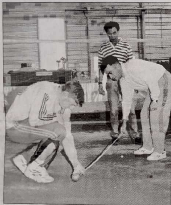
Cette fois, on entre dans le vif du sujet. Après d'ultimes répétitions, il faudra viser juste aujourd'hui pour espérer rejoindre le club des seize meilleurs demain.

Depuis ce matin, 8 heures, se sont ouverts les XX es championnats de France corporatifs de triplettes. Après une ultime journée d'effervescence du côté de l'organisation.