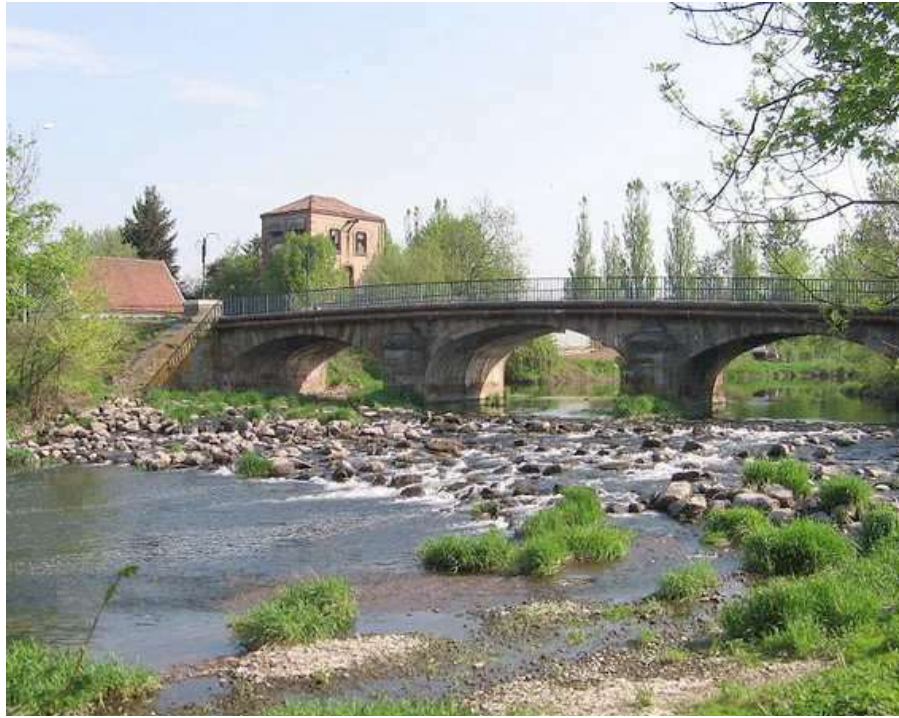
La Rivière L'Oignon, qui fait souvent ses petits caprices, en inondant les quartiers de Lure

Ce 20 ème Championnat de France corporatif , s'est déroulé à Lure (70).