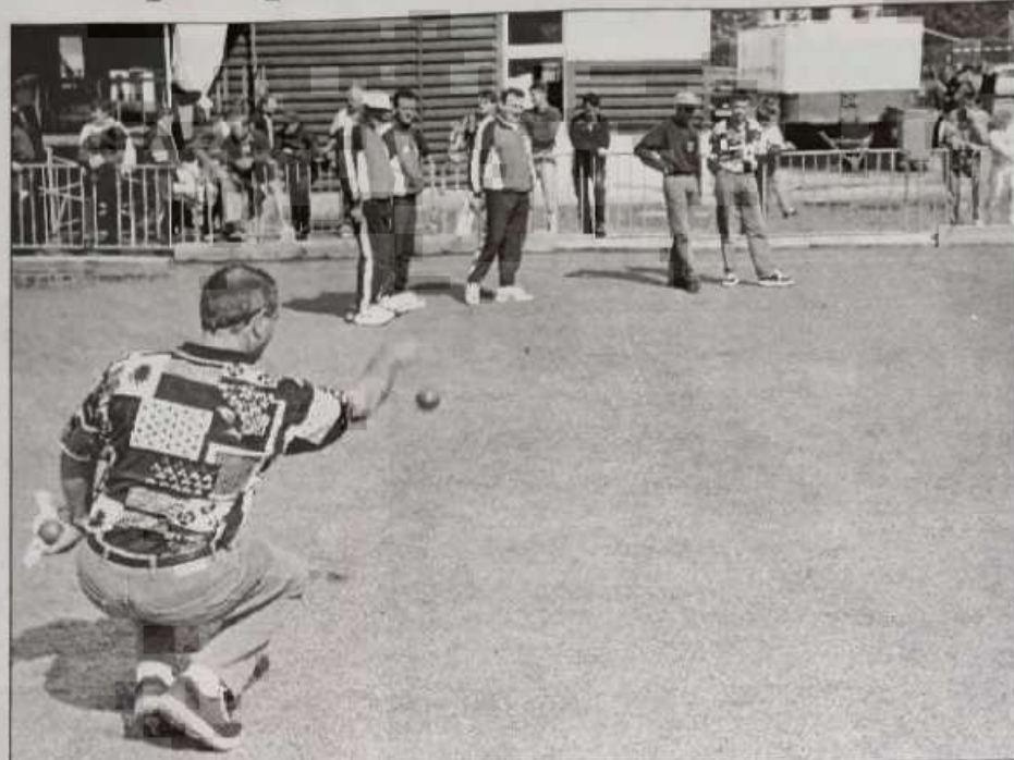
Il pointe ou il tire.