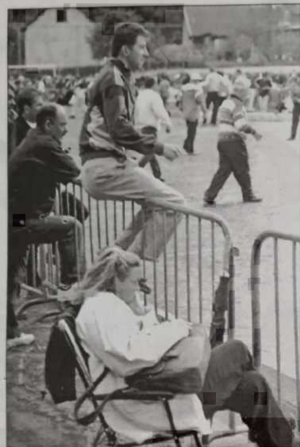
L'après-midi permettait une position décontractée après les trombes d'eau.

375 licenciés corpo s'affrontent depuis hier, qu'il fasse beau ou qu'il pleuve à seaux !