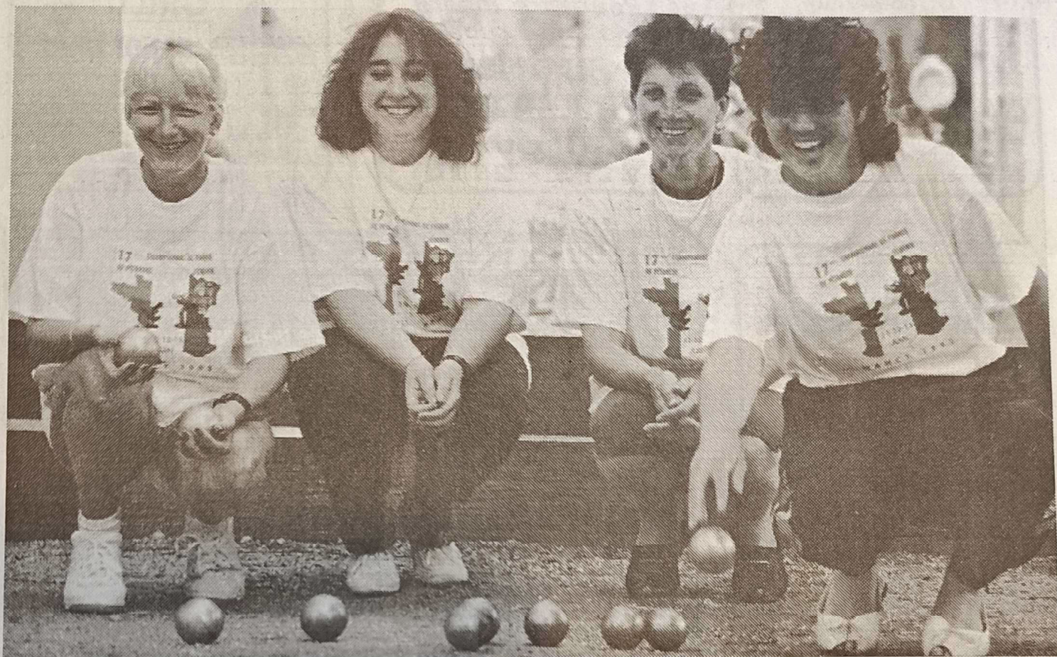
Quatre des championnes départementales dans un dernier entraînement au stade Saint-Don de Dombasle.

Samedi et dimanche, place Carnot, se jouera le 17 e championnat de France de pétanque féminin. Les représentantes de Dombasle, championnes de Meurthe-et-Moselle, ne veulent pas manquer ce rendez-vous sur leur terre lorraine.