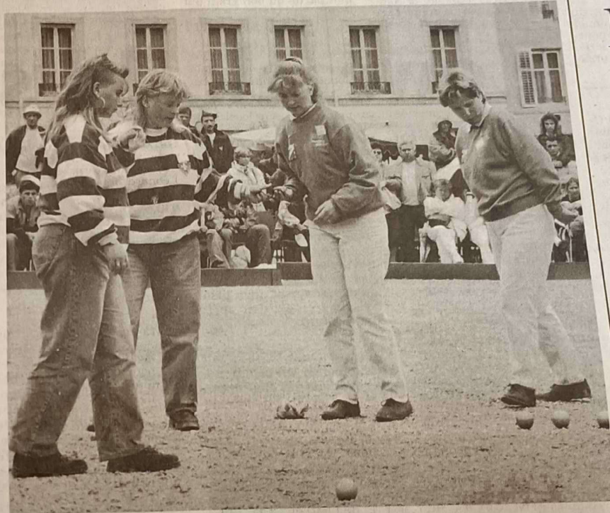
Le moment tendu du calcul des points et du choix de jeu.

Dole-Dupon (Côte d'Or) bat Applagnat - Applagnat (Savoie): 13 - 6.