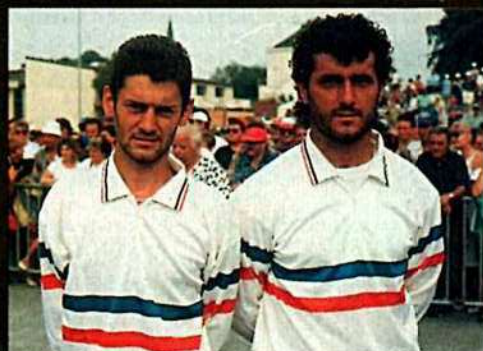
MILEI - RADNIC