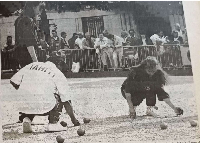
Elles étaient venues de Tahiti, mais elles ont été rapidement éliminées. Pour elles, l'important n'était-il pas de participer ?