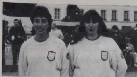
1/4 finale Seine-St-Denis.

savoyardes et ne manquent pas l'occasion de revenir au score : 6/4.