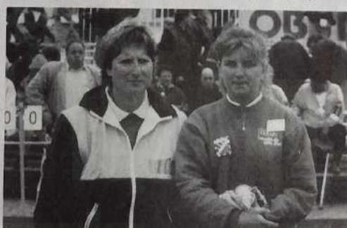
1/4 finaliste Côte d'Or.

confrontation sera dominée par le tir malgré des jets de bouchons rarement en-dessous des 9 m. Kouadri et Gelin s'imposent une nouvelle fois ponctuant leur victoire par quatre frappes à la dernière mène dont deux superbes carreaux.