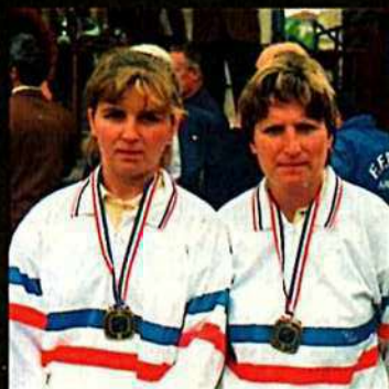
DUPON - DOLE