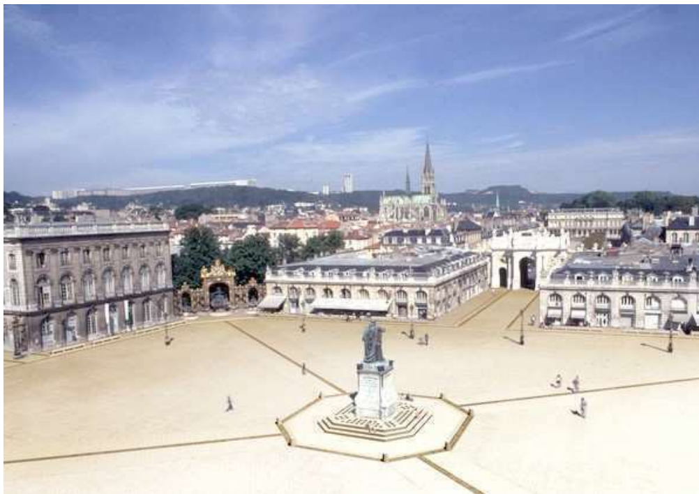
Le célèbre Place Stanislas (ex-Place Royale) à Nancy, avec ses portes et fontaines, aux fameuses ferronneries dorées, de style Rococo

C'est la ville de Nancy (54), qui a été l'hôte de ce Championnat de France féminin pétanque.