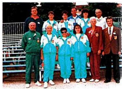
Organisateurs et joueurs de Meurthe-et-Moselle

Les célèbres grilles de la place Stanislas.