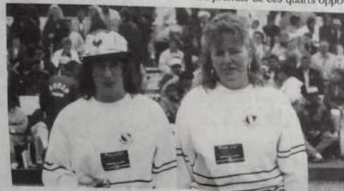
1/4 finale Bas-Rhin.