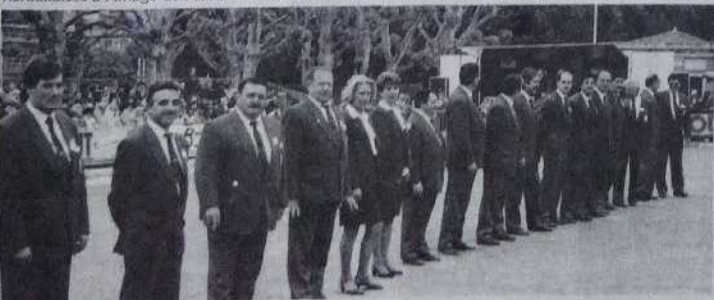
Le comité organisateur au grand complet.

Reste à féliciter l'équipe organisatrice pour la qualité de son accueil et l'excellent déroulement de ces championnats. Bravo encore d'avoir réussi à trouver des terrains en pleine ville.