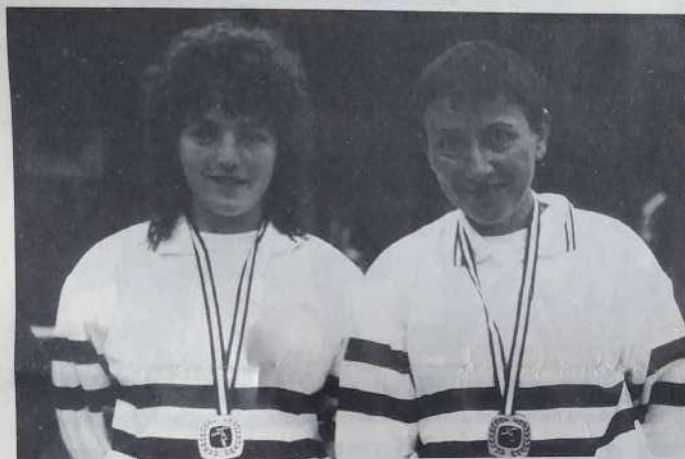
Les championnes de France arborant leurs nouveaux maillots et les médailles d'or de la F.F.P.J.P.