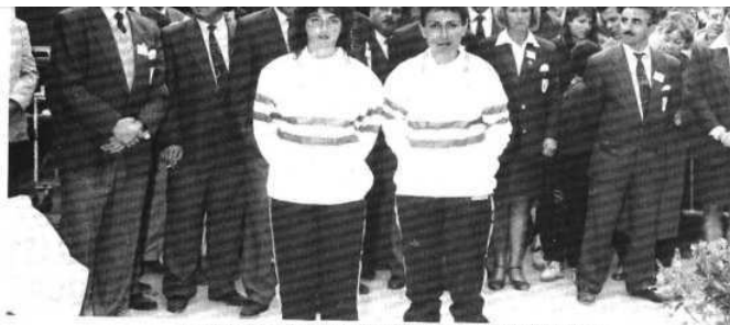
Les deux championnes viennent de revêtir le maillot tricolore. Au second plan, le comité d'organisation presque au grand complet.