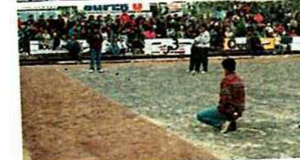
De haut en bas :