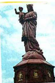
Notre-Dame du Puy