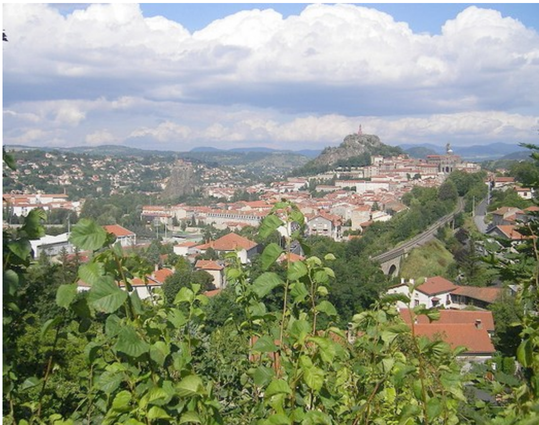
La ville du Puy-en-Velay, qui est le point de départ de la Via Podiensis, un des itinéraires du pèlerinage des Chemins de Compostelle

C'est la ville du Puy-en-Velay (43), qui a été l'hôte de ce Championnat de France féminin pétanque.