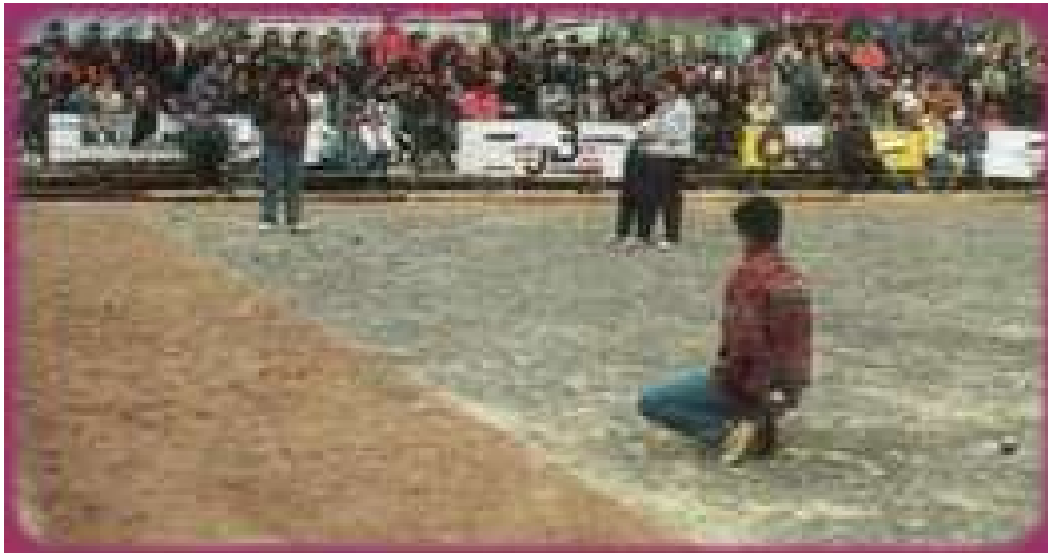
Une rencontre de 1/4 de finale, qui a opposé le (31) au (69) en 1994 au Puy-en-Velay