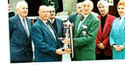
De haut en bas :