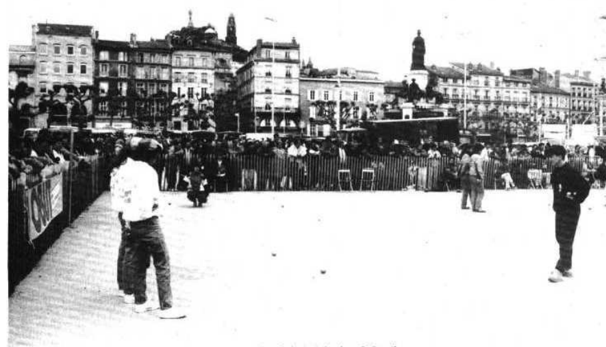
Vue générale de la place du Breuil.

● HUMOUR... QUAND TU NOUS TIENS !! L'entendu, sous forme de devinette, dans un groupe de personnes apparemment sérieuses : - Quel est le plus beau rêve d'une boule de pétanque ? - L'amour des suçons... et la vie à la colle avec le but. Un rêve... cochonnet !!