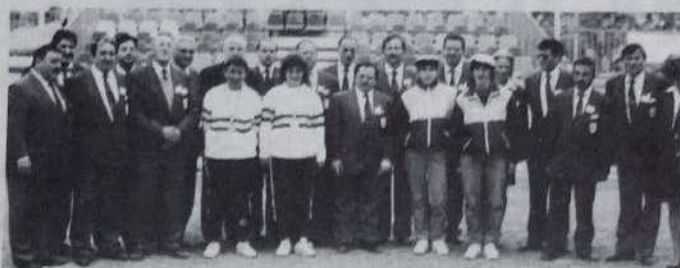
Les finalistes et le comité.