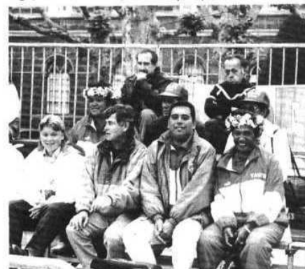
La délégation venue de Polynésie a été rapidement adoptée par le public puyot.

● Au total, 254 joueuses ont répondu à l'invitation lancée par la ligue régionale Auvergne-Bourbonnais et par le comité de Haute-Loire de pétanque.