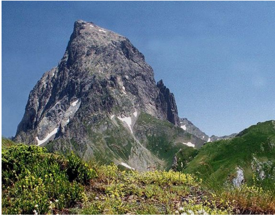
Le Pic du Midi d'Ossau (surnommé le Jean-Pierre), qui culmine à 2884 mètres et est visible depuis Pau et tout le Béarn. A ne pas confondre avec le Pic du Midi de Bigorre et son observatoire

Ce Championnat de France Tête-à-tête senior , s'est déroulé les 4 et 5 juillet 1981 à Pau (64), patrie du Roi Henry IV «Nouste Henric».