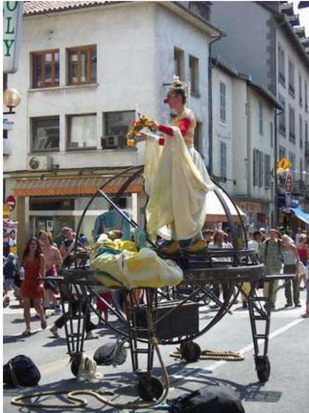
La ville d'Aurillac et son célèbre festival de théâtre de rue

Ce Championnat de France Tête-à-tête senior pétanque , s'est déroulé les 30 juin et 1er juillet 2001 à Aurillac (15).