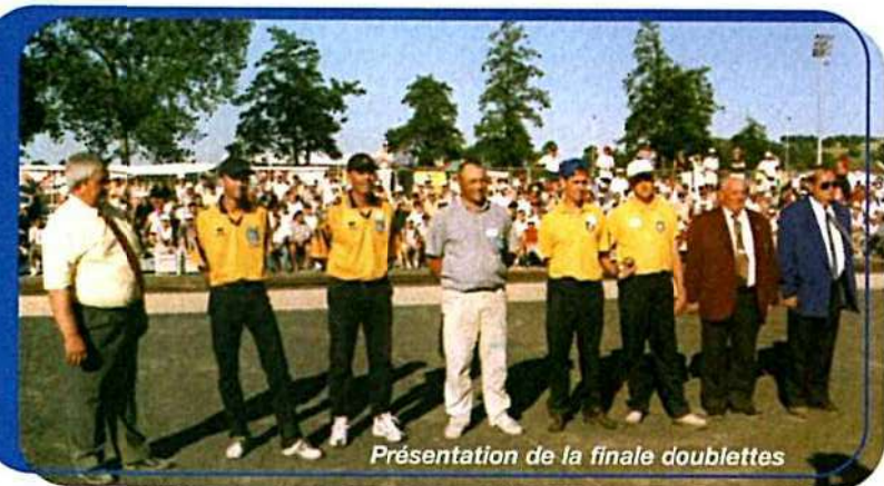
Présentation de la finale doublettes