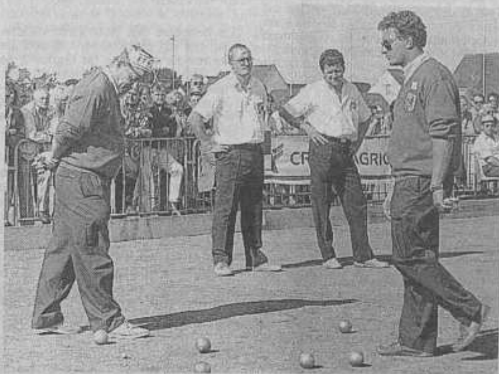
Les Gardois équipe vainqueur au centre.

nats de France ont pris de l'épaisseur. On joue plus serré entre initiés, suspense et spectacle garantis. On mesure l'adversaire puis l'accent se réveille, la Provence s'affirme. Ces 18 e championnats de France ont été fertiles en rebondissements avec des équipes prestigieuses, les doublettes Capelle-Laffleur des Alpes de Haute-Provence ou encore Caribère-Moly du Languedoc-Roussillon, malmenant celles des Pyrénées Orientales