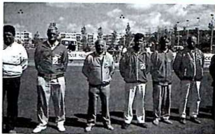
Le corps arbitral.