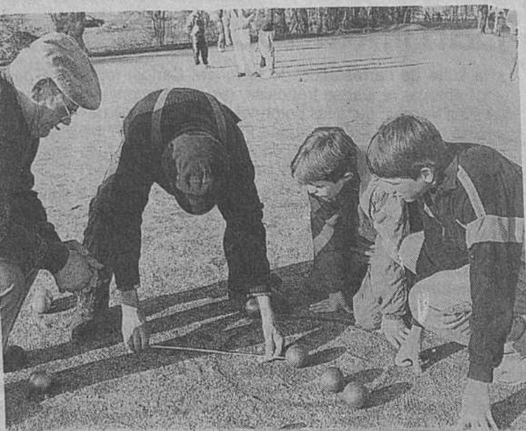
Tourlaville accueille, dimanche 28 août, le championnat de France de jeu provençal.