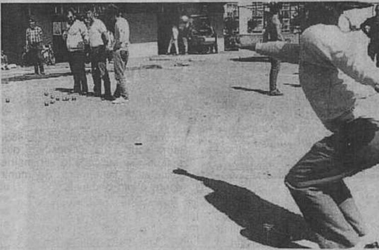
Dans le Nord-Cotentin, les adeptes de la pétanque classique sont nombreux. Mais pendant trois jours à Pont-Marais, ils peuvent découvrir le jeu provençal.

Au total 85 équipes vont s'affronter dès aujourd'hui de 8 h à 12 h et à partir de 14 h ; samedi de 8 h à 12 h et à partir de 14 h ; dimanche, demi-finales à partir de 8 h et finale à 15 h. Remise des prix à 18 h 30. Vendredi et samedi l'accès est gratuit. En revanche dimanche, le tarif d'entrée est fixé à 30 F pour la journée,