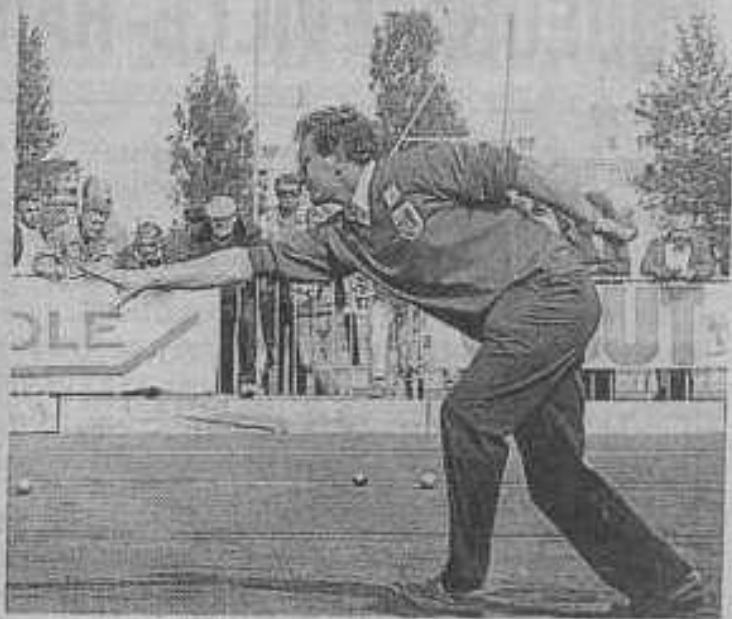
La particularité du jeu provençal.