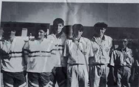
Champions et vice-champions juniors.

pouvait commencer. Difficile ici de suivre toutes les parties, mais au fil des jeux j'ai pu voir la détresse des uns et l'assurance des autres, des déconvenues cinglantes et de vrais exploits, des minois consternés et des explosions de joie. Dans ces catégories d'âge, chaque partie est un véritable petit drame qui se joue. L'œil du coach et la présence des parents venant encore augmenter la sensibilité des participants. Témoin cette partie