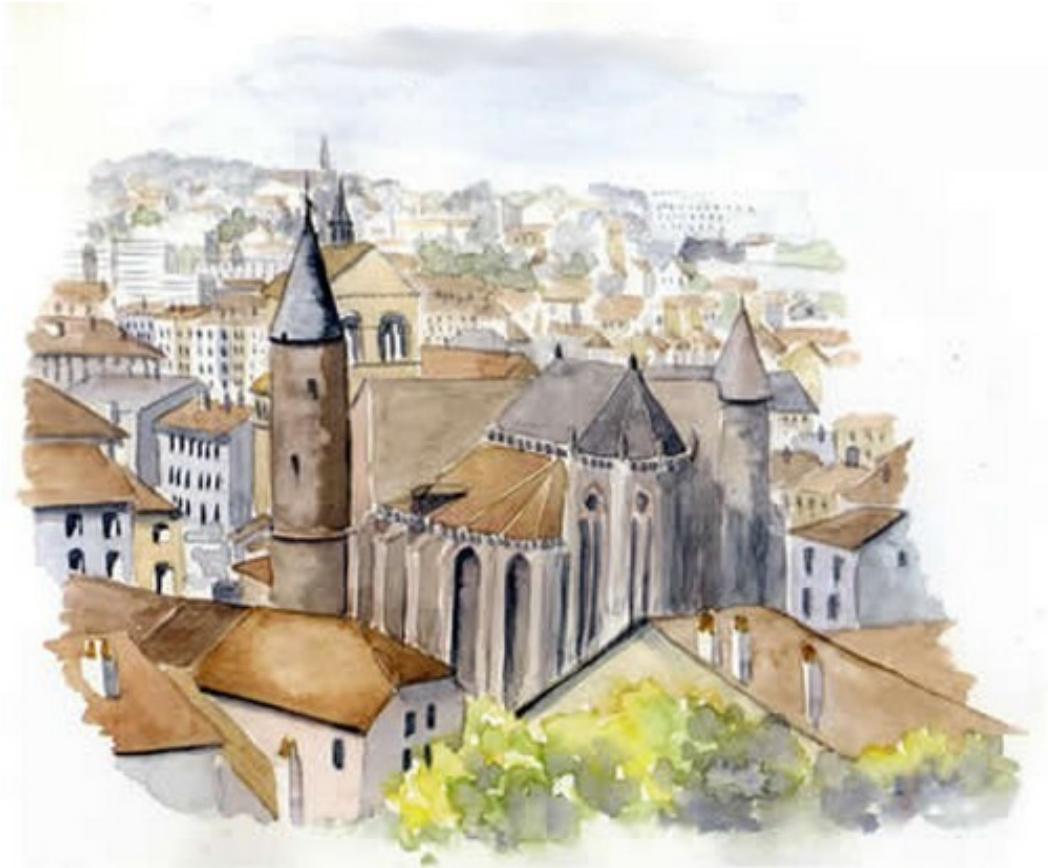
Epinal et sa basilique Saint-Maurice (aquarelle de Claude Papkoff-Tollard)

Le 2 ème Championnat de France Doublette mixte , en 1994 à Epinal (88), aura été en fait le 2 ème et dernier Trophée National mixte (à partir de 1995, il deviendra Championnat de France Doublette mixte).