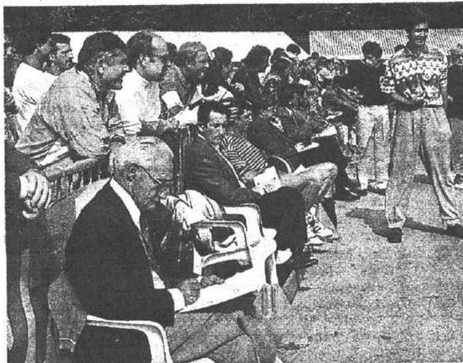
Un public de connaisseurs.