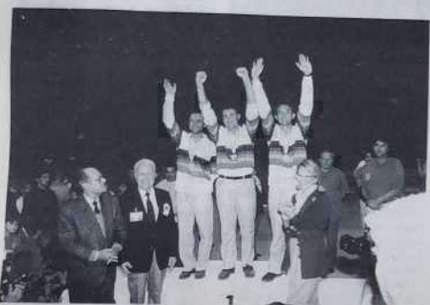
Les Franciliens, champions du monde

L'organisation d'un championnat du monde est toujours un défi. Mais lorsque c'est la France qui le relève cet événement devient alors un symbole. Car dès lors on mesure, avec la venue d'équipes des cinq continents, le chemin parcouru depuis ce mois de juin 1910 où un certain Ernest Pitlot proposa à son ami Jules Lenoir perdu de rhumatismes de faire une partie à courte distance en plaçant les pieds joints dans un cercle.