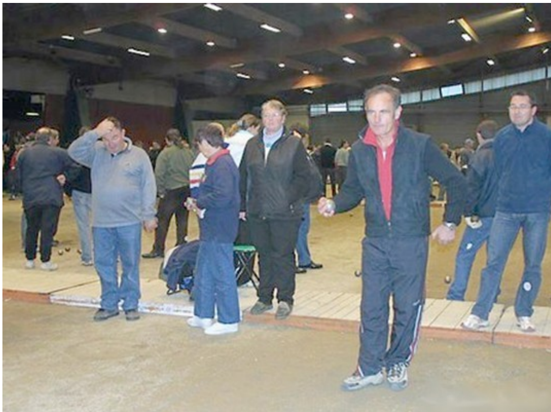
C'est dans l'enceinte du Parc des Expositions et à l'intérieur de ce Parc Elan à Alençon, que s'est déroulé ce Championnat mixte

Ce Championnat de France Doublette mixte s'est déroulé à Alençon (61).