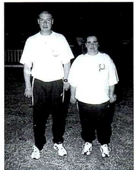
L'autre équipe demi-finaliste.