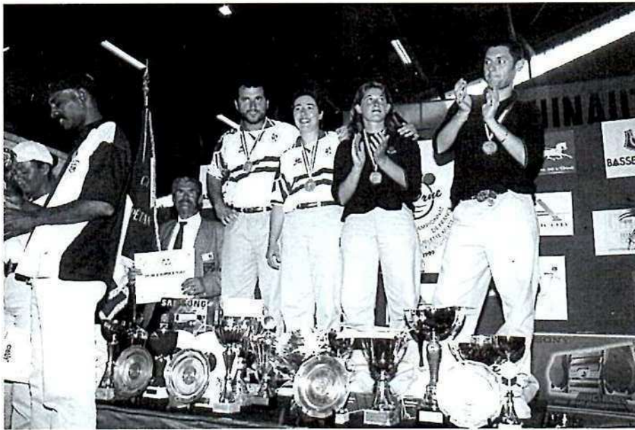
Champions et vice-champions du même club !