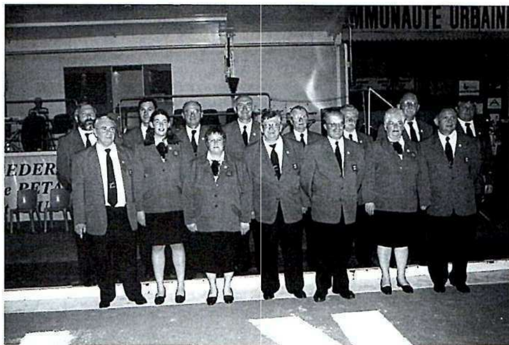
L'équipe organisatrice. Exceptionnels!