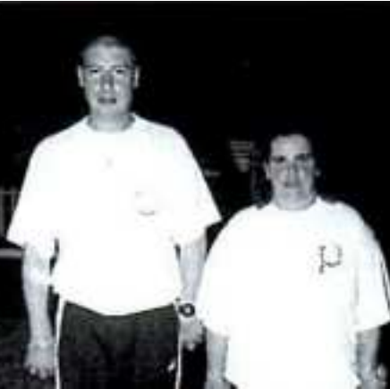
Les 2 Doublettes mixte 1/2 finalistes de ce Championnat de France pétanque 1999