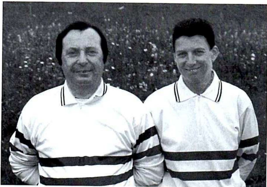
PASSO-SARDA : encore en tricolore.