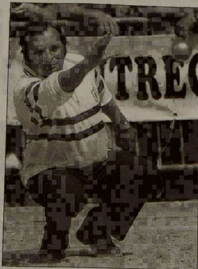
Sarda-Schatz seront encore là aujourd'hui en huitièmes pour défendre leur titre 97.