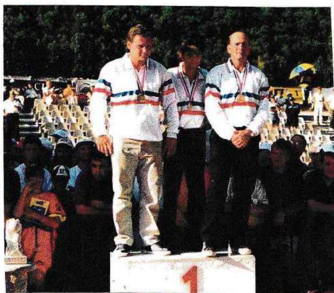
CHAMPIONS DE FRANCE