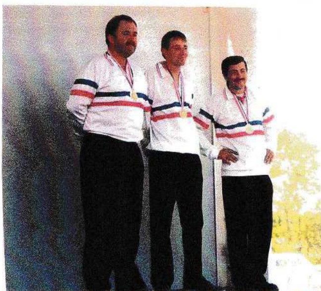
CHAMPIONS DE FRANCE