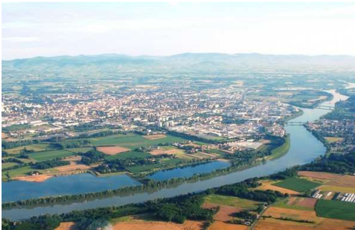
Baignée par la rivière Saône, la ville de Villefranche-sur-Saône capitale du Beaujolais, a accueilli ce Championnat mixte

Ce 4 ème Championnat de France Doublette mixte s'est déroulé à Villefranche-sur-Saône (69).