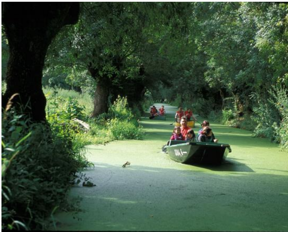
La ville de Niort appelée aussi La Venise verte, par la présence toute proche du marais Poitevin

C'est la ville de Niort (79) et son marais Poitevin tout proche, qui a été l'hôte de ce Championnat de France féminin pétanque.