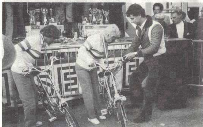
A Niort, l'année dernière, les deux nouvelles championnes de France examinent un de leurs prix : une bicyclette.

qui tire aux deux jeux, et qui tient la dragée haute aux hommes.