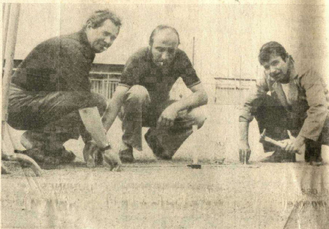
Trois hommes (du comité départemental) à Noron pour préparer la venue des championnes

8 h 30 : début du championnat au parc des expositions (parties de boules ; les parties seront terminées avant le déjeuner (signal au sifflet).