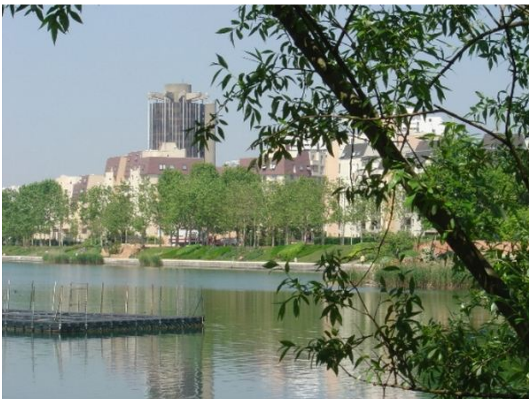
Le lac de Créteil, attenant au Parc de Loisirs, où s'est déroulé ce Championnat féminin

C'est la ville de Créteil dans le Val-de-Marne, qui a été l'hôte de ce Championnat de France féminin pétanque.