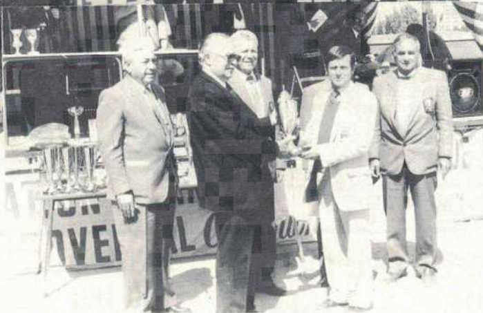
Le passage du flambeau

avantage décisif qui se solda par une victoire 13 à 4. Il reste à féliciter Carbillet et Rodriguez qui en se trouvant une nouvelle fois en demi-finale confirment leur valeur.