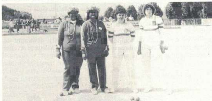
L'équipe de Polynésie et les championnes sortantes

• Les championnes en titre sont opposées à Sarda-Coros de l'Hérault, championne de la ligue Languedoc-Roussillon. Une partie dont on attend beaucoup tant la prestation des deux équipes avait été excellente au cours des tours précédents. Malheureusement l'équipe Seine-et-Marnaise d'emblée ne trouvera pas son rythme et les joueuses de l'Hérault prirent rapidement un