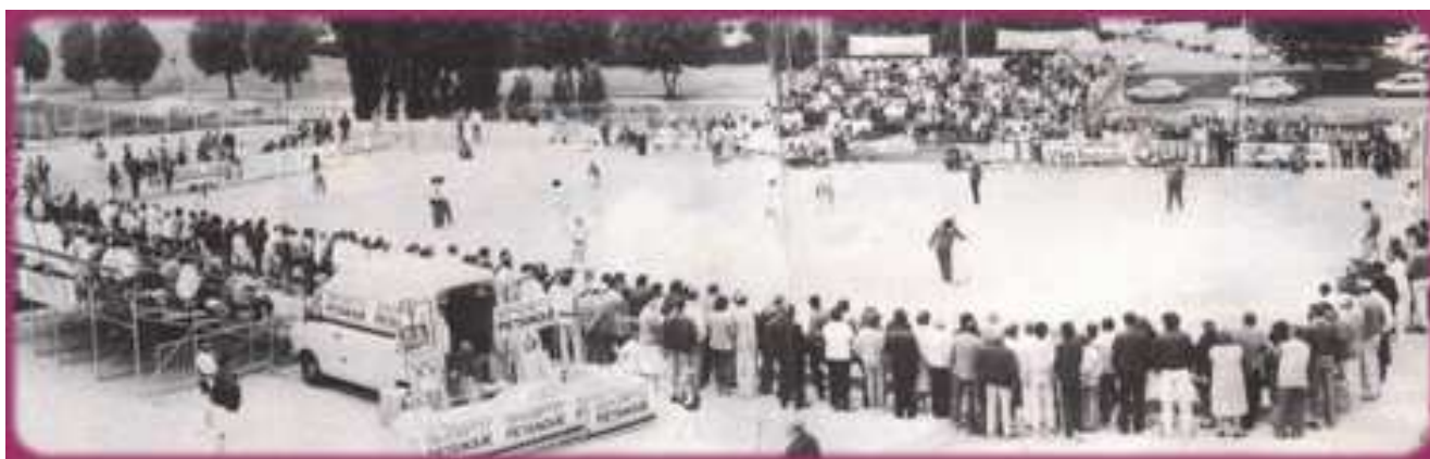
Une vue générale des terrains d'honneur de ce Championnat féminin à Créteil en 1986