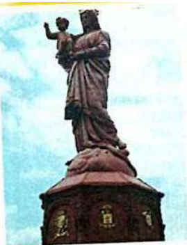
Notre-Dame du Puy