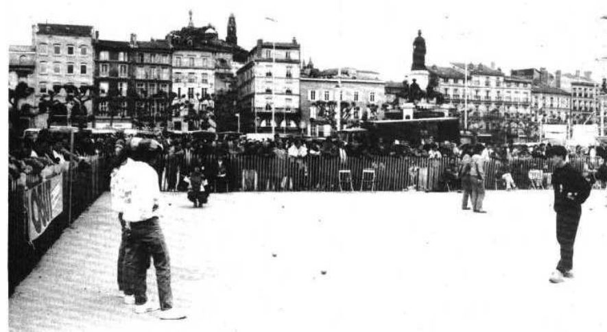
Vue générale de la place du Breuil.

● HUMOUR... QUAND TU NOUS TIENS !! L'entendu, sous forme de devinette, dans un groupe de personnes apparemment sérieuses : - Quel est le plus beau rêve d'une boule de pétanque ? - L'amour des suçons... et la vie à la colle avec le but. Un rêve... cochonnet !!