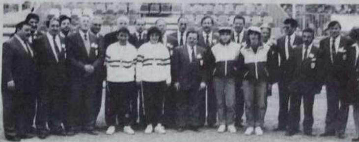
Les finalistes et le comité.