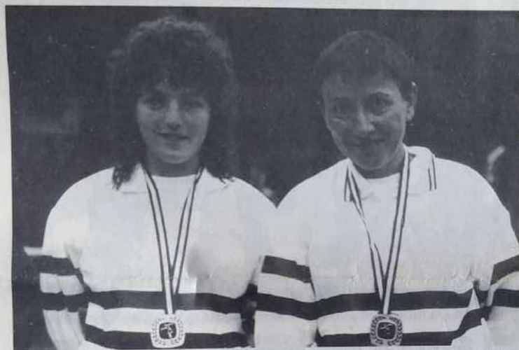
Les championnes de France arborant leurs nouveaux maillots et les médailles d'or de la F.F.P.J.P.