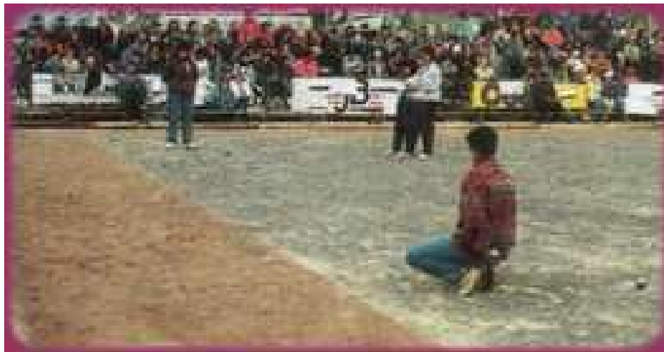
Une rencontre de 1/4 de finale, qui a opposé le (31) au (69) en 1994 au Puy-en-Velay