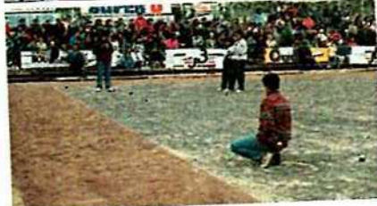
De haut en bas :