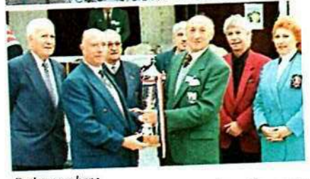
De haut en bas :