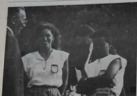
Vice-championnes de France.

nes); Rathberger bat Collombet (Ain); Stavelot bat Gros (Bouches-du-Rhône).