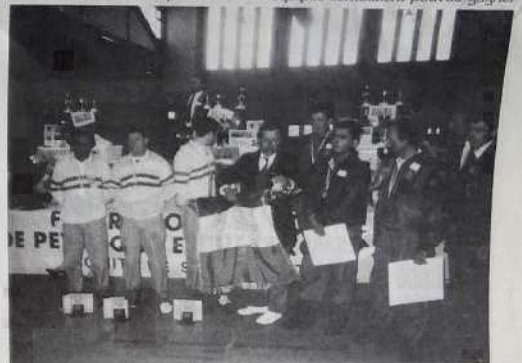
Les finalistes à la remise des prix

Dans les demi-finales, les quatre équipes semblaient pouvoir gagner