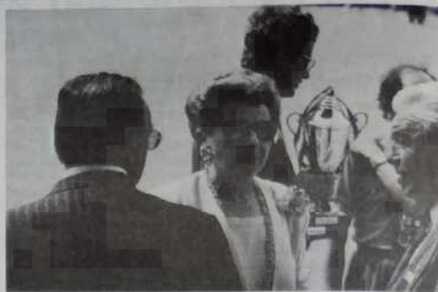
Madame le maire de Jouy-en-Josas.