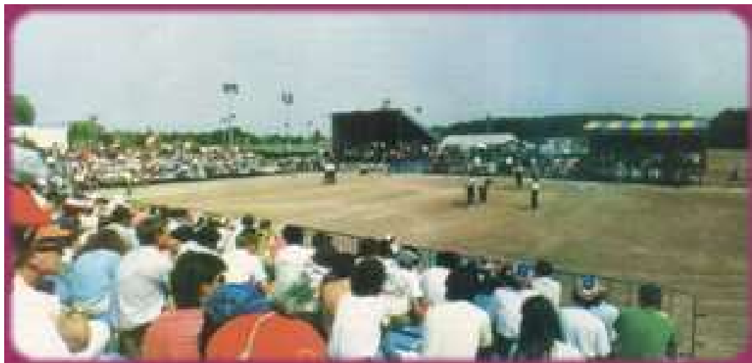
Une vue générale de la phase finale de ce Championnat de France, le dimanche après-midi

Les tenantes du titre 1991 du (21) : Dole, Dupon se sont inclinées en 1/4 de finale, face aux futures Finalistes de Naert, Moreau (92) sur le score de 11 à 13.