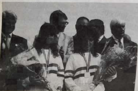
Championnes de France.