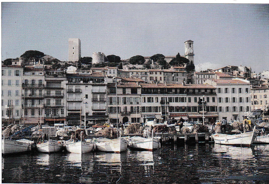
LE SUQUET - LE VIEUX PORT