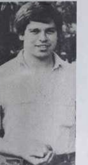
Raccabarra (Mourenx) tenant du titre à tête.

Cette liste de noms reste bien sûr objective dans la mesure où rien n'est peut-être plus fragile qu'un pronostic en pétanque. Il n'en reste pas moins que Foyot déjà connu des Pauois