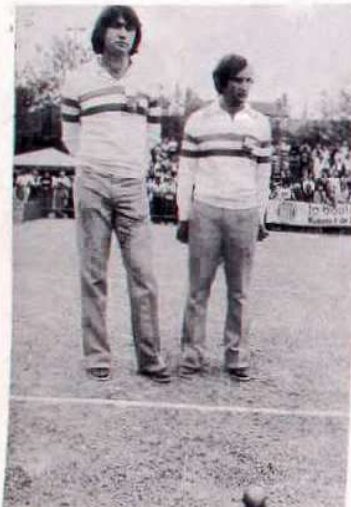
Foyot-Stéphani : les Parisiens tenants du titre ont chuté en quart de finale