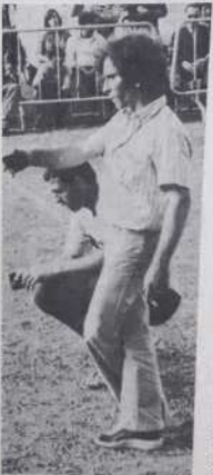
J.-M. Foyot (Paris) tenant du titre en doublettes.

La pétanque ne jouissait pas d'une bonne réputation et nous avons travaillé à redorer son blason, disent les