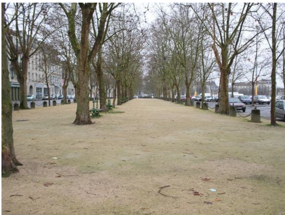
La Place de Verdun à Pau, où s'est déroulé ce Championnat de France en 1981 et où les Paloïs taquinaient quotidiennement la petite boule

Ce Championnat de France Doublette senior , s'est déroulé les 4 et 5 juillet 1981 à Pau (64), patrie du Roi Henry IV «Nouste Henric».