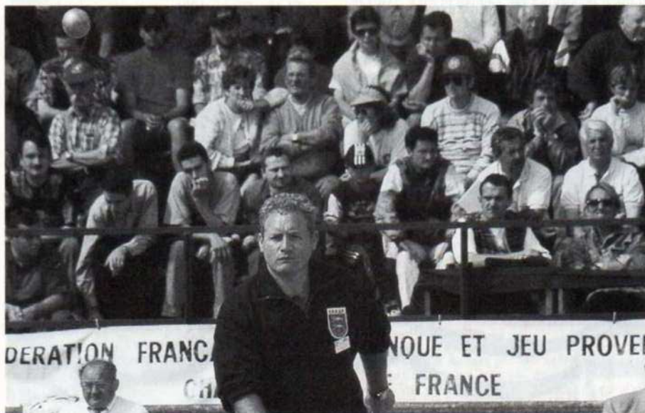
HERVO, battu en 1/4 de finale par BOUILLON-PORCHER.

Michel BRIAND (Gard) bat Bruno CASTELLAN (Bouches-du-Rhône) 13 à 12.