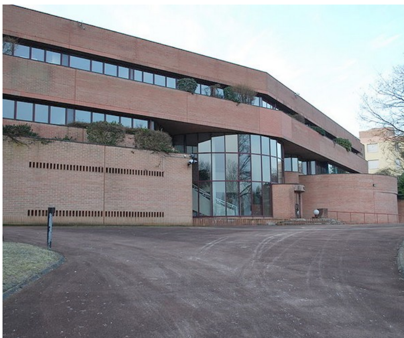
Le bâtiment du Centre National d'Information Routière (le fameux Bison-Futé) implanté à Rosny-sous-Bois

Ce Championnat de France Doublette senior , s'est déroulé les 6 et 7 juillet 1996 à Rosny-sous-Bois (93).