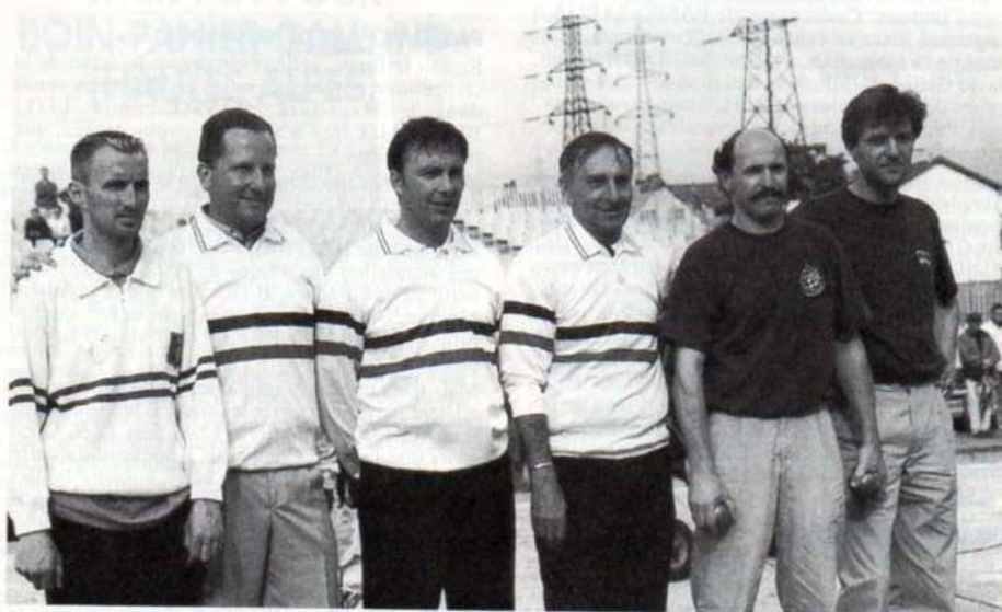
Le podium des championnats de France doublette et tête à tête.