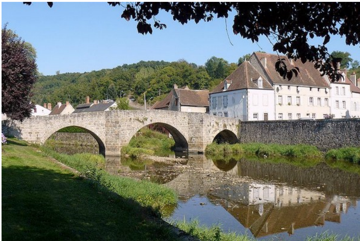
La ville de Chambon-sur-Voueize et son pont roman, qui enjambe la rivière Voueize

Ce Championnat de France Doublette senior , s'est déroulé les 4 et 5 juillet 1998 à Chambon-sur-Voueize (23).