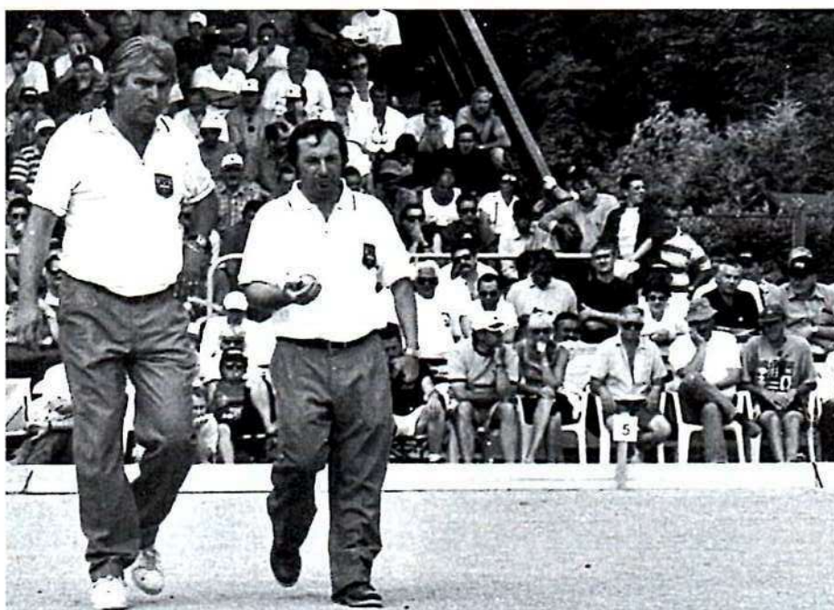
FOYOT-PASSO, pas de titre en doublette.

FOYOT, le choc de deux générations, de deux façons d'appréhender la pétanque mais aussi de deux équipes qui se disputent l'hégémonie française depuis bien des années.