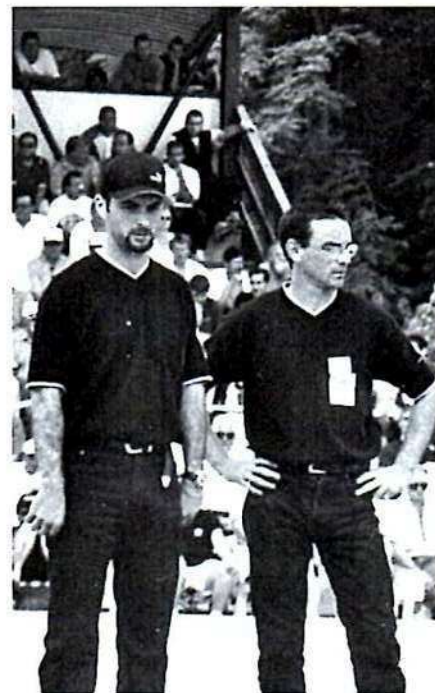
LE DANTEC-VERGOZ, battus par PASSO-FOYOT