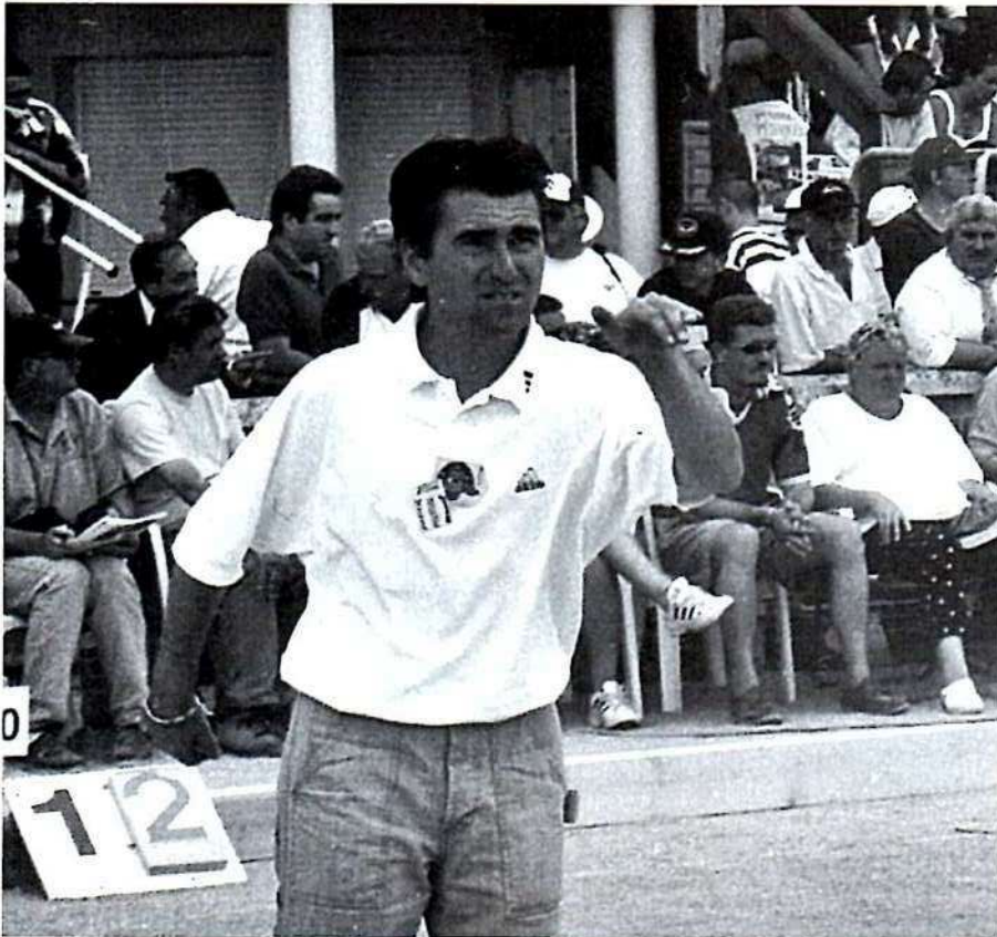
CHAPELAND, quelle saison !