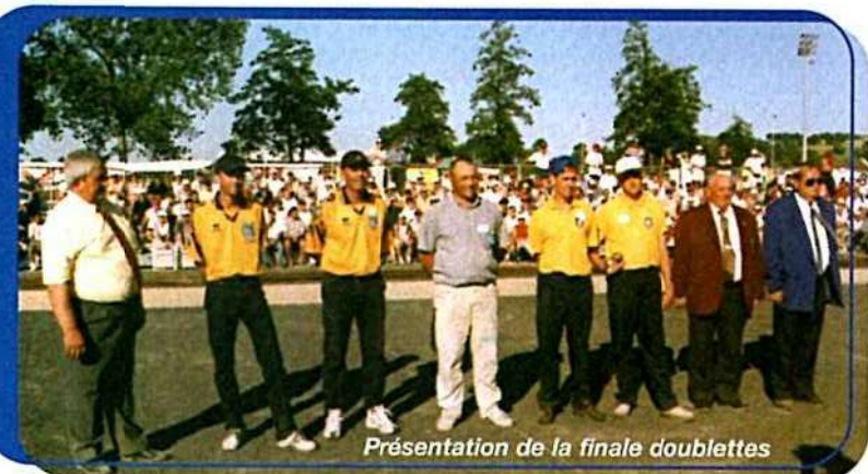
Présentation de la finale doublettes