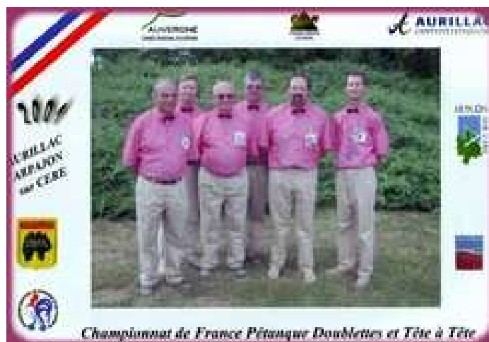
Les arbitres lors de ce Championnat de France pétanque, à la mode show-biz, ils en jettent !

L' arbitrage de ces 2 journées sportives, a été supervisé par l'arbitre international Joseph Sorrentino, bien secondé par ses 5 assistants.