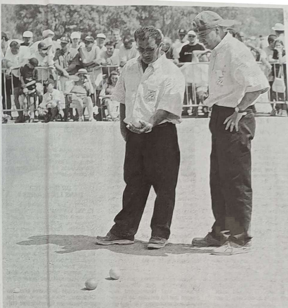
La doublette cantalienne Mongil-Bauer, poussée par le public acquis à sa cause, a créé la première sensation de la journée.