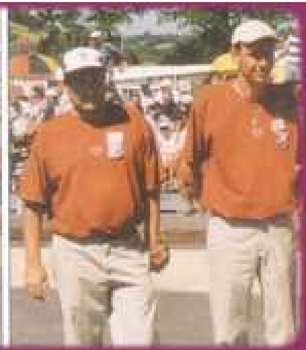
Les 2 Doublettes 1/2 finalistes de ce Championnat de France pétanque, en 2001 à Aurillac