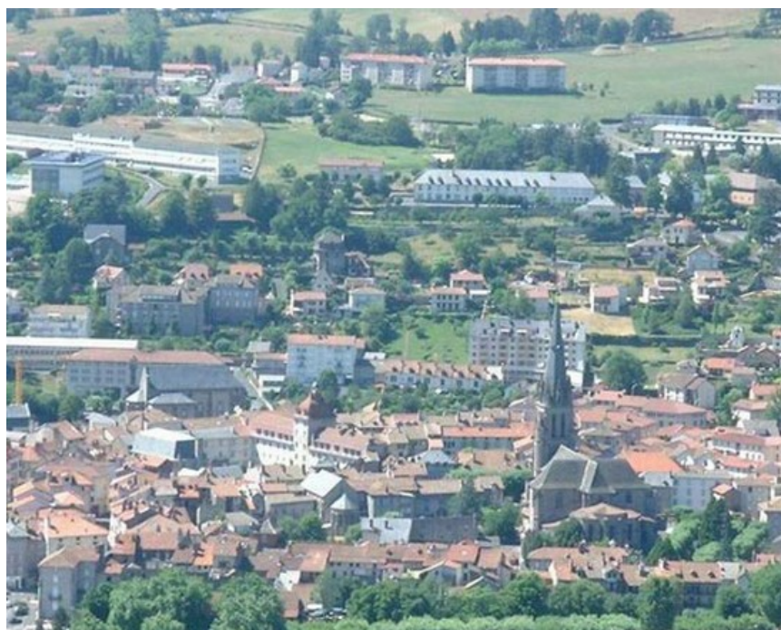
Une vue générale de la ville d'Aurillac, qui a accueilli ce Championnat de France pétanque, en 2001

Ce Championnat de France Doublette senior , s'est déroulé les 30 juin et 1er juillet 2001 à Aurillac (15).