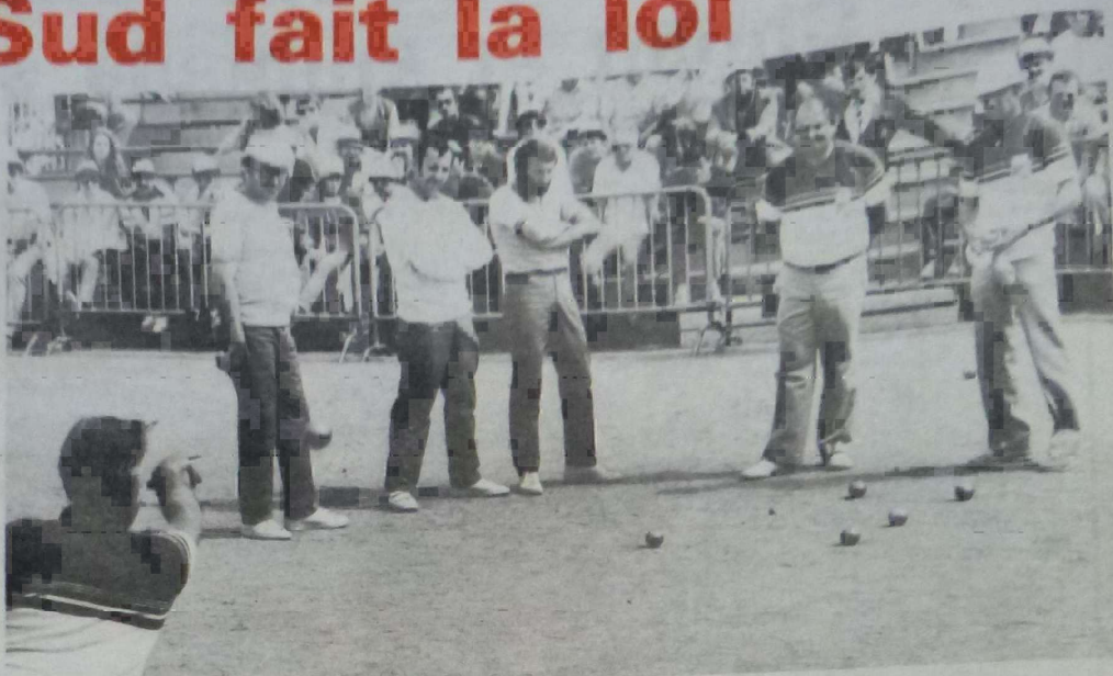
Les deux équipes finalistes face à face.

tour, mais se faisait éliminer au tour suivant lors des cadrages par l'équipe de l'Ariège sur le score sans appel de 13-3. Malgré tout l'équipe P.T.T. du Loiret se voyait attribuer la coupe du département non pas pour sa performance mais parce qu'elle s'est distinguée vis-à-vis de ses deux rivaux.