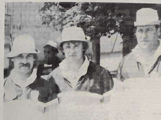
Le Cher a fait bonne figure, allant jusqu'en quart de finale