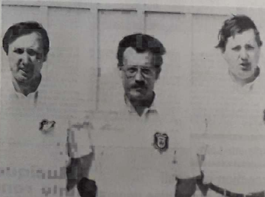
Inesta-Sevestre-Nardoux, la meilleure équipe du Loiret

Orléans. — « Ce n'est pas mal, mais cela aurait pu être mieux », ce constat s'appliquait bien aux équipes du Loiret.