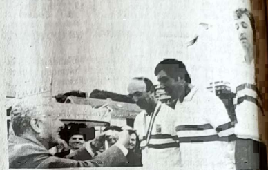
Le président de la Fédération remet les médailles aux champions, l'équipe Gers

Le titre est revenu à l'équipe de Rochefort