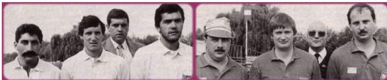
Les 2 Triplettes corporatives 1/2 finalistes : à gauche le (13), à droite le (02)