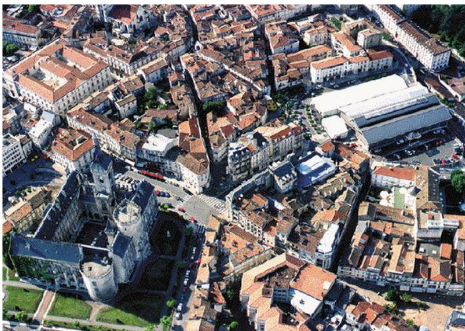
Vue aérienne de la ville d'Angoulême, en Saintonge, à gauche le château des Comtes d'Angoulême, devenu l'Hôtel de Ville

Ce Championnat de France corporatif , s'est déroulé à Angoulême (16) les 20 et 21 juin 1987.