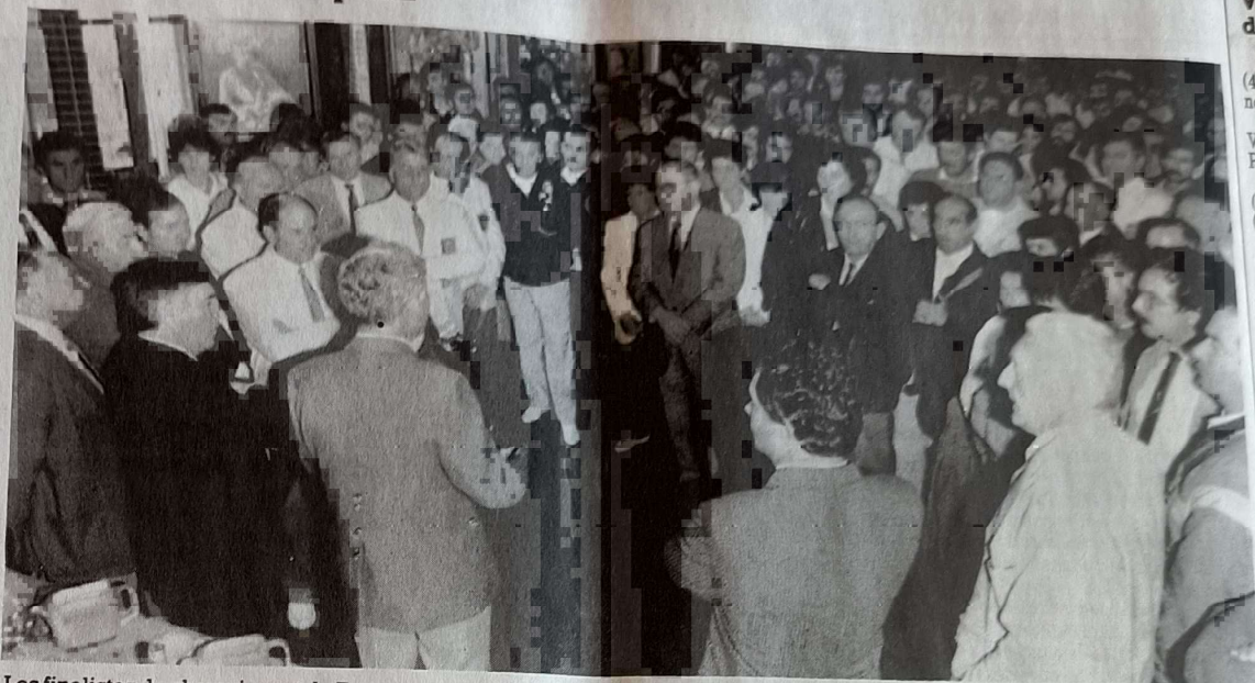
Les finalistes du championnat de France corporatif ont été reçus hier soir à l'hôtel de ville d'Angoulême