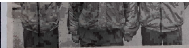
L'équipe de Loire-Atlantique Leray-Olmos-Rondineau