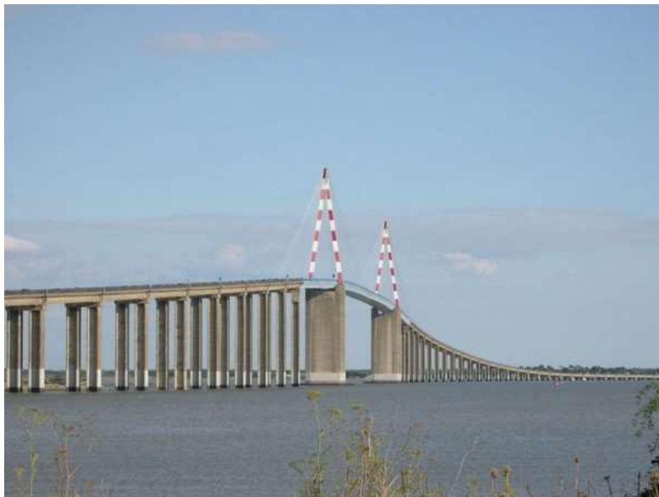
Le pont de Saint-Nazaire, d'une longueur de 3350 mètres et qui enjambe l'estuaire de la Loire et permet de relier Saint-Nazaire et Saint-Brévin-les-Pins