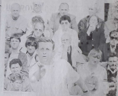
Olmos en action