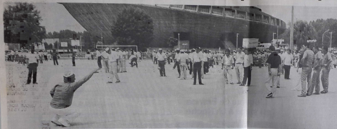
Certains ont bu la tasse au pied de la Soucoupe

SAINT-NAZAIRE. Bien sûr le petit vent qui balaya durant deux jours les terrains de jeu ne procurait pas la sensation de bien-être du souffle chaud du mistral, bien sûr il fallait tendre l'oreille pour entendre le chant mélodieux des cigales mais enfin avec un peu d'imagination, et en fermant les yeux, on pouvait se croire sur les bords de la Méditerranée en plein milieu du parc Borely haut lieu de la pétanque hexagonale. « Je la pointe ou je la tire ? ». Durant