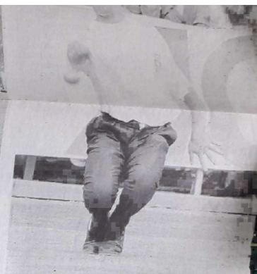
Rondineau, un placement hors pair