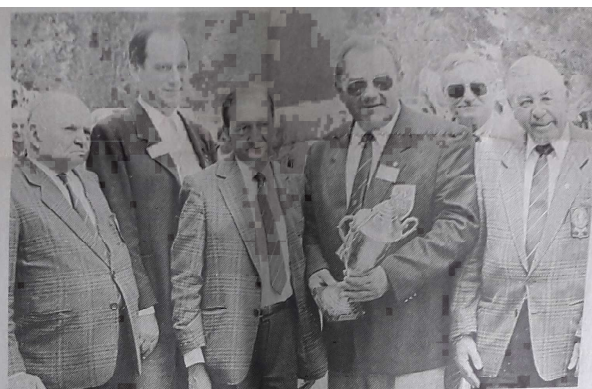
Passation du flambeau. En 91, la compétition aura lieu à Figeac