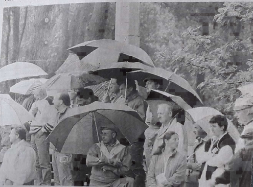
Un p'tit coin de parapluie pour un p'tit coin de paradis

La publicité fait acheter et vivre mieux