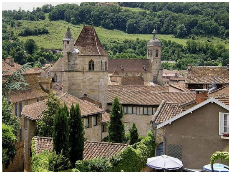
La ville de Figeac, sur les bords du Célé, qui a accueilli ce Championnat corporatif

Ce Championnat de France corporatif , s'est déroulé à Figeac (46) les 15 et 16 juin 1991.