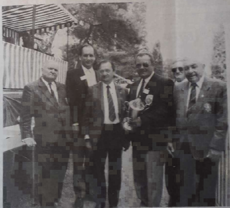
Une coupe prestigieuse, objet des rêves les plus fous des 127 triplettes qualifiées pour ce championnat de France.

Rappelons, en particulier, à l'intention des philatélistes, que deux cartes postales tirées chacune à 500 exemplaires (une avec un dessin de Polonski et une avec un dessin de Verne) seront en vente, de 8 heures à 19 heures, à la maison