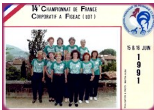
Onze des 13 Dames du Comité d'Organisation de ce Championnat corporatif à Figeac en 1991

Ce Comité d'Organisation, avait pensé à la parité, puisque pas moins de 13 dames en faisaient également partie.