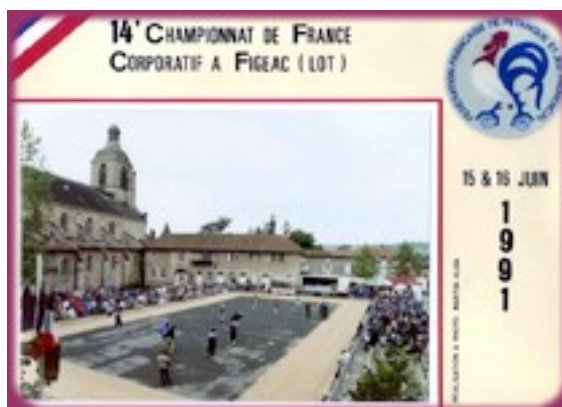
Une vue des phases finales de ce Championnat corporatif à Figeac en 1991 : cette compétition s'est déroulée sous une chaleur suffocante le samedi Quant au dimanche, la pluie a humidifié les terrains implantés face aux Carmes Figeacois