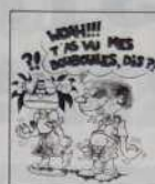
Ref.: T 03