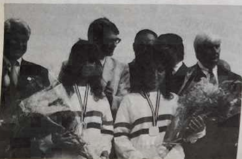
Championnes de France.