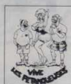
Ref.: T 04