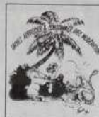
Ref.: T 06

Ref. T01 - L / XL : Blanc, bleu, jaune, fuschia S / M : Blanc, saumon, vert, parme 8/10 ans - 4/6 ans - 2/3 ans : Blanc, saumon, vert, parme Ref. T02 - L / XL : Blanc, bleu, jaune, fuschia S / M : Blanc, fuschia, saumon, vert, parme Ref. T03 - S / M - L / XL : 12/14 ans - 8/10 ans - 4/6 ans - 2/3 ans Blanc, saumon, vert, parme Ref. T04 - S / M et L / XL : Blanc, vert, bleu, rose Ref. T05 - 2/3 ans - 4/6 ans - 8/10 ans : Blanc, saumon, vert, parme Ref. T06 - 2/3 ans - 4/6 ans - 8/10 ans - 12/14 ans - S / M - L / XL : Blanc Ref. T07 - idem ci-dessus Ref. T08 - idem ci-dessus