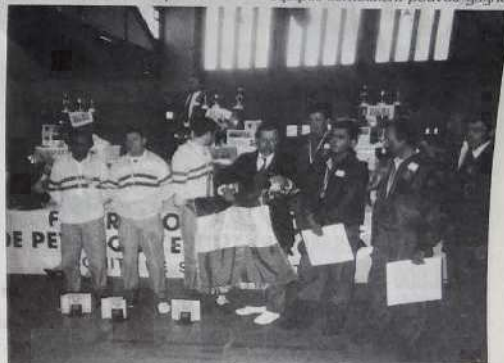
Les finalistes à la remise des prix

Dans les demi-finales, les quatre équipes semblaient pouvoir gagner