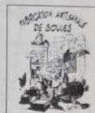
Ref.: T 08