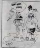
Ref.: T 01