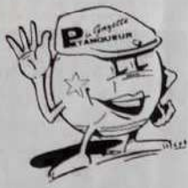
Dessin figurant sur les 3 articles ci-contre

Tailles : S / M - L - XL : 80 Francs ou 8 bons parrainage de 2 à 14 ans : 60 Francs ou 6 bons parrainage