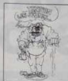
Ref.: T 02