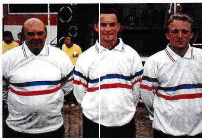
Les champions de Seine-Maritime