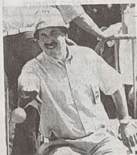
Conduite par Polonais, l'équipe cantalienne formée avec Roux et Reynier, est la meilleure représentante de la région. Elle jouera en huitièmes de finale ce matin.

Pour apprécier les évolutions des joueurs, il en coûtera 30 F.